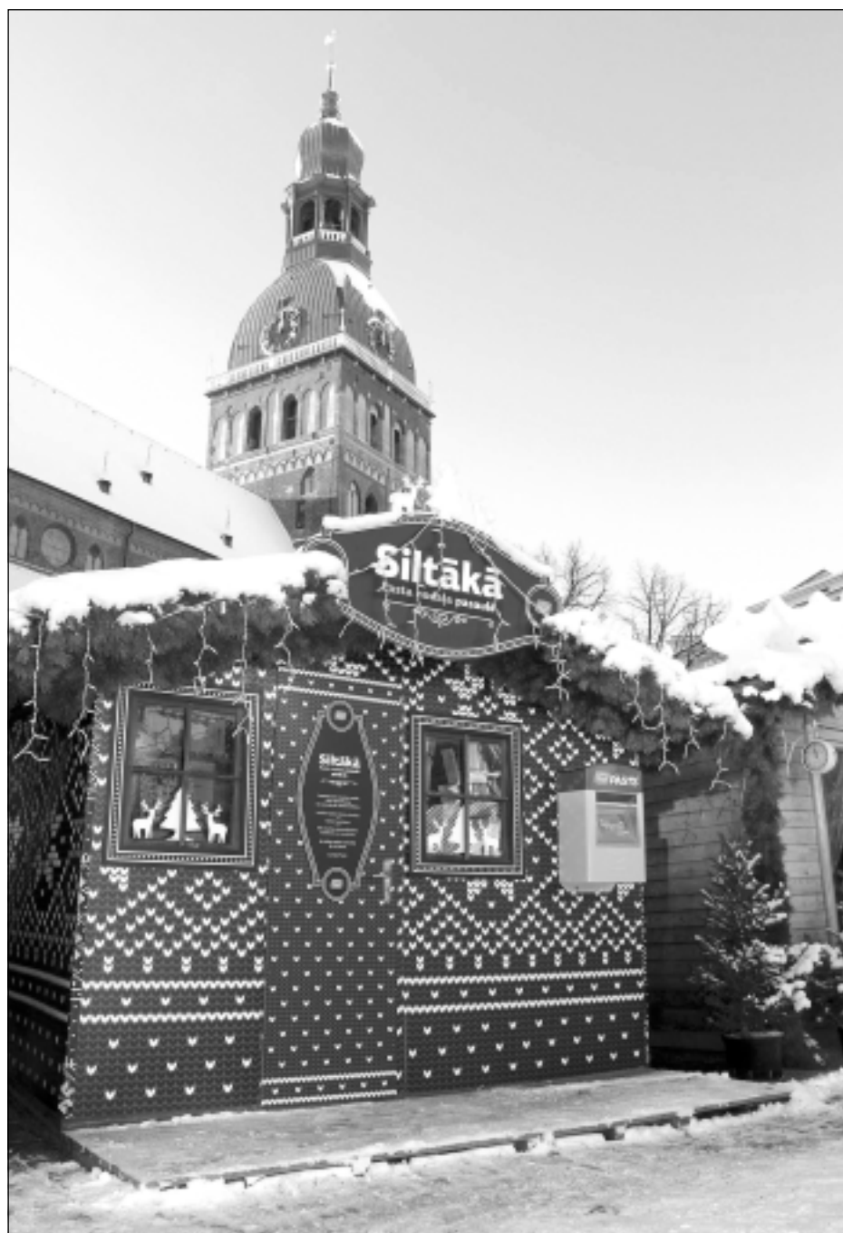
Siltākā pasta nodaļa. Rīgā, Doma laukumā, darbojas šī krāšņā un interesantā pasta nodaļa, ko varēs apmeklēt līdz pašam decembra beigām.