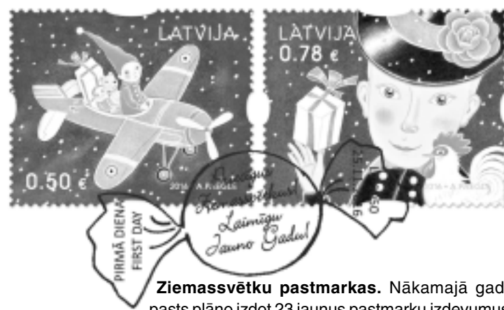
Ziemassvētku pastmarkas. Nākamajā gadā pasts plāno izdot 23 jaunus pastmarku izdevumus.