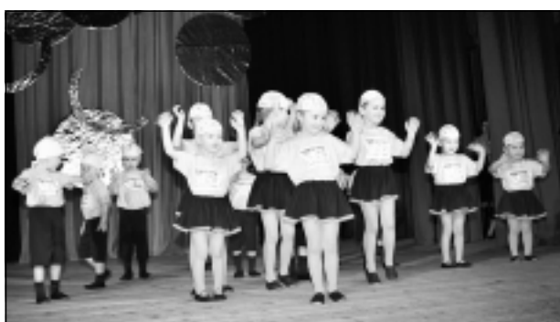
Vismazākie konkursanti. Par spīti tam, ka daudziem mazajiem dejojājiem šī bija pirmā uzstāšanās reize, viņi nenobijās kāpt uz skatuves pirmie. Deju studijas "Terpsihora" ritmikas grupas "Cālēni" dejojāņu drosmi žūrija novērtēja ar 1. pakāpi.