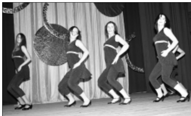
Šova deju grupa "LEO". Balvu Amatniecības vidusskolas meiteņu deju populārs izraisīja vētrānus skatītāju aplausus. Ilgā un saspringtā deju fragmentu savirkņējuma laikā (ne katrs vīrietis varētu izturēt šādu maratonu) no meiteņu sejām ne mirkli nenozuda smaids, arī deju solis ne reizi nesamisējās. Mazliet dīvaini, ka žūrija priekšnesumu novērtēja tikai ar 3. pakāpi.

Lappusi sagatavoja I. Tušinska, A. Kirsanova foto