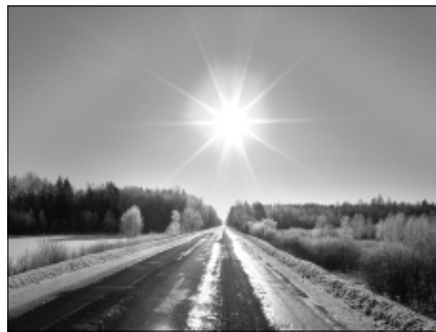
Tieši uz dienvidiem.