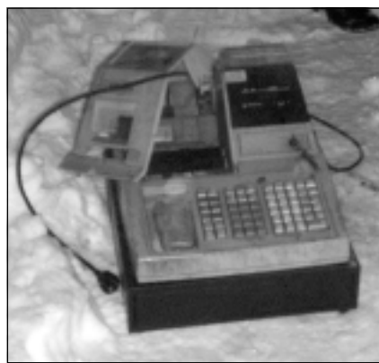
Izglāb kases aparātu. Neko daudz no veikālā esošajām mantām un precēm izglābt neizdevās. Ugunsdzēsēji iznesa kases aparātu.