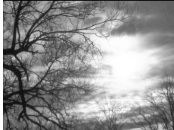
Saulriets. Iesūtīja Rudite Šapale no Rugāju novada.