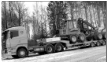
Treilera pakalpojumi. Tālr. 29113399.