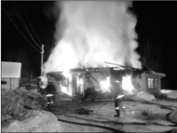
Deg veikals. Zinātāji saka, ka aukstā laikā vilkme ir īpaši laba un uguns paceļas gaisā augstu jo augstu.

Uzņēmējam Šķilbēnu pagastā pieder trīs veikali, un nodegušais bija viens no tiem. Tajā tirgoja pārtikas preces un pirmās nepieciešamības preces, kā jau laukos tas ierasts. Tagad Šķilbēnu centrā palikusi tikai degvielas uzpildes stacija. Uzņēmējs sola, ka veikals Šķilbēnos būs, bet vispirms novāks gruvešus, kas palikuši pāri no vecās ēkas.