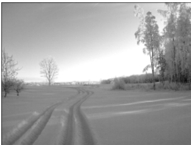
Ziemas ceļš.

Katra mēneša labākās fotogrāfijas autors balvā saņems žurnālu komplektu. Februāra tēma "Tver dienu!". Fotogrāfijas var iesūtīt pa pastu - Balvi, Teātra ielā 8, LV-4501, vai elektroniski - vaduguns@apollo.lv. Pie foto obligāti norādāms vārds, uzvārds (vēlams - tālrunis).