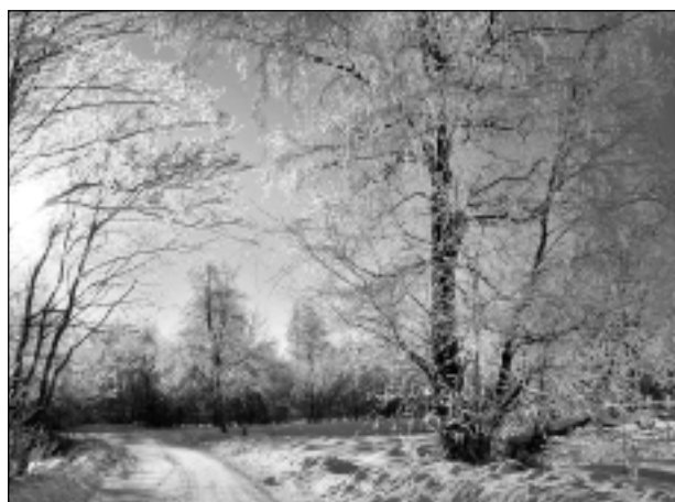
Sarma kokos. Iesūtīja Vilhelms Laganovskis.