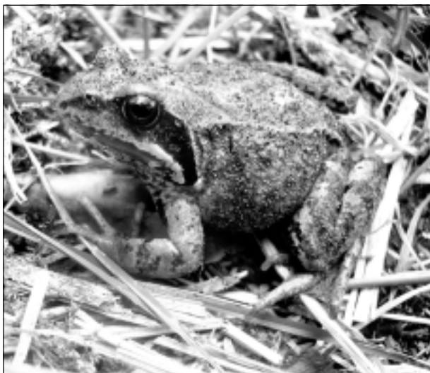
Kvā, kvā, kvā! Iesūtīja Marija Poševa no Bērzpils.

Katra mēneša labākās fotogrāfijas autors balvā saņems žurnālu komplektu. Septembra tēma "Uz skolu prom, un basta". Fotogrāfijas var iesūtīt pa pastu – Balvi, Teātra ielā 8, LV-4501, vai elektroniski – vaduguns@apollo.lv. Pie foto obligāti norādāms vārds, uzvārds (vēlams - tālrunis).