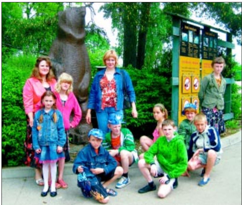
Lāčus nebaros. Bērni tagad zina, ka zoodārza dzīvniekus barot aizliegts, jo lāči no nepiemērotas barības var nomirt.