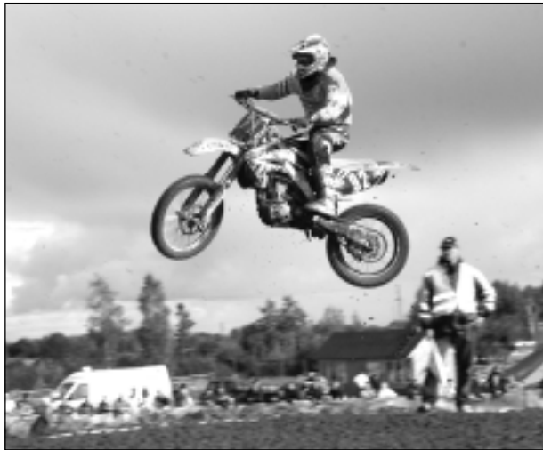
"Baltā brieža" trasē. Motobraucēju lēcieni nereti sasniedz pat 40 metrus, liekot aizrauties skatītāju elpai.

Ir rakstīti projekti un tiek meklēti Eiropas finansējums trases labiekārtošanai. Plānots sakārtot infrastruktūru - izbū-