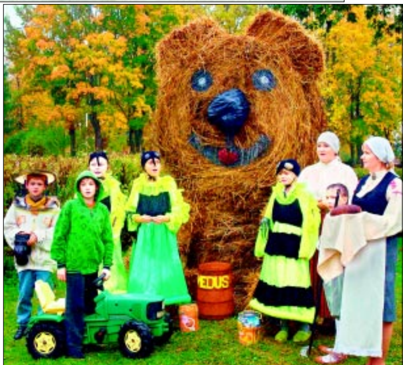
Izgatavo siena lāci. Bērniem labi paveicās lāča figūras darināšana no siena ruļļiem un salmu ķīpām.