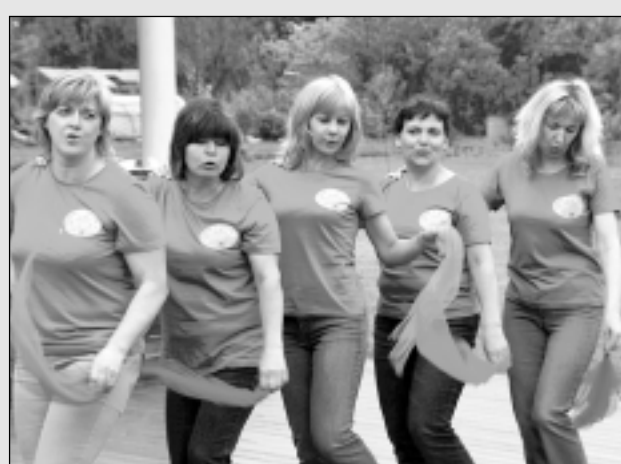
Pirms-skolas iestāžu darbinieces tiek sastāvēs sporta spēlēs.

● Kādēļ Balvos vairāk nav kinoteātra? Jautā iedzīvotāji