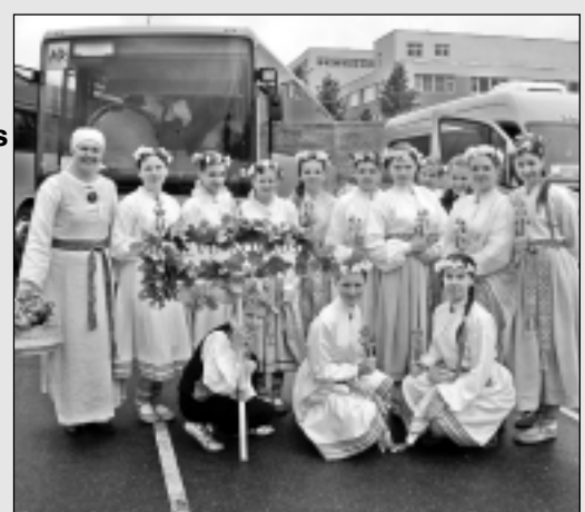
Piedalās festivālā "Latvju bērni danci veda".