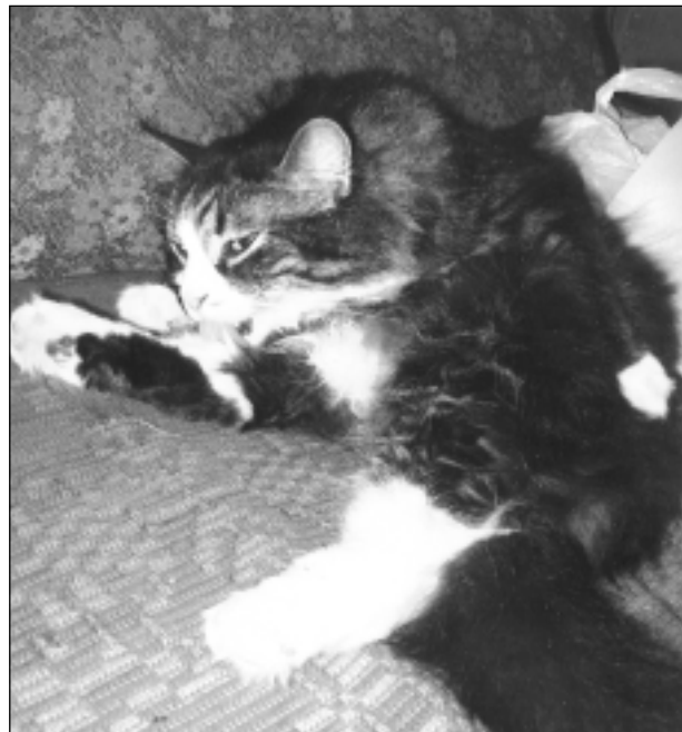
Labāk par dušu!

Katra mēneša labākās fotogrāfijas autors saņems balvu. Fotogrāfijas var iesūtīt pa pastu – Balvi, Teātra ielā 8, LV-4501, vai elektroniski – vaduguns@apollo.lv. Pie foto obligāti norādāms vārds, uzvārds (vēlams - tālrunis).