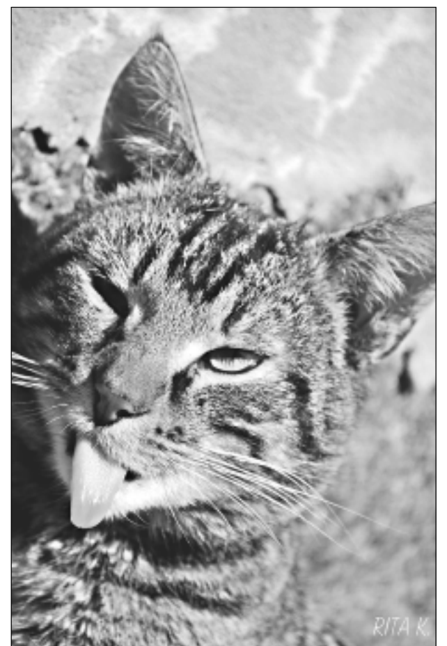
Pavasara nogurums. Iesūtīja Rita Keiša.