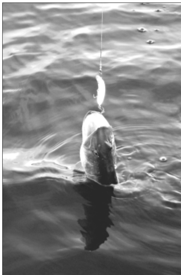
Līdaciņ! Iesūtīja Liene Šaicāne no Balviem.

Katra mēneša labākās fotogrāfijas autors balvā saņems žurnālu komplektu. Maija tēma: "Pārsteidz it viss!" Fotogrāfijas var iesūtīt pa pastu – Balvi, Teātra ielā 8, LV-4501, vai elektroniski – vaduguns@apollo.lv . Pie foto obligāti norādāms vārds, uzvārds (vēlams - tālrunis).