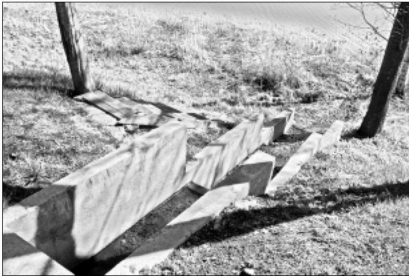
Ezers aizaug. Notekūdeņi, kas no pansionāta attīrīšanas iekārtām ieplūst ezerā, veicina tā aizaugšanu.