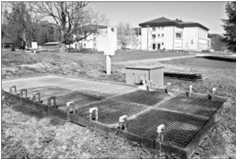
Attīrīšanas iekārtas. Tās būvē ar mērķi, lai kalpotu pēc iespējas ilgāk. Pansionāta "Balvi" bioloģiskās attīrīšanas iekārtas ekspluatācijā nodeva pirms nepilniem sešiem gadiem, taču slikti notekūdeņu testēšanas rezultāti parādījās pēc pusgada. Acimredzot pasūtītājiem un procesu kontrolējošajiem speciālistiem ir jābūt prasīgākiem un vērīgākiem attiecībā pret attīrīšanas iekārtu izbūvi un uzstādīšanu.

cijas projektu. Projekta tāmi esam iesnieguši novada pašvaldībā, kura pārziņā esam. Ceram uz risinājumu."