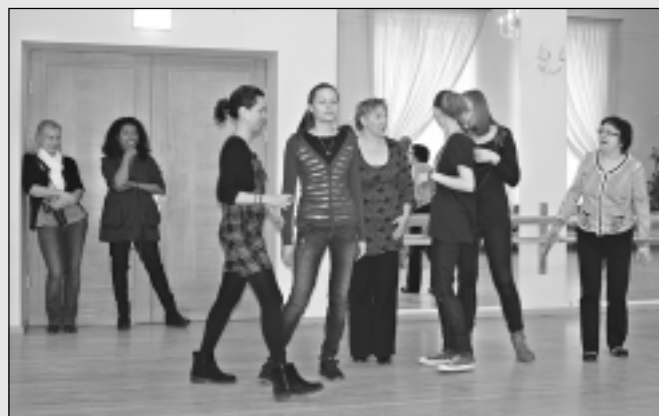
Mācās improvizēt no amerikāņiem.