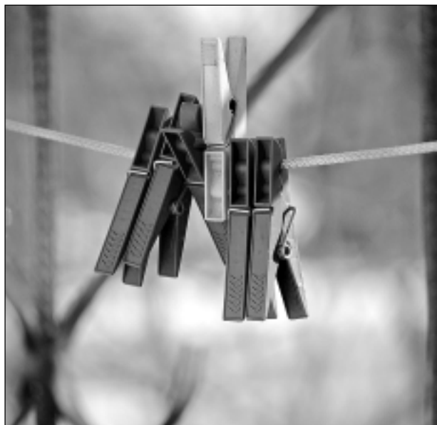
Aiz loga.

Katra mēneša labākās fotogrāfijas autors balvā saņems žurnālu komplektu. Maija tēma: "Pārsteidz it viss!" Fotogrāfijas var iesūtīt pa pastu – Balvi, Teātra ielā 8, LV-4501, vai elektroniski – vaduguns@apollo.lv. Pie foto obligāti norādāms vārds, uzvārds (vēlams - tālrunis).