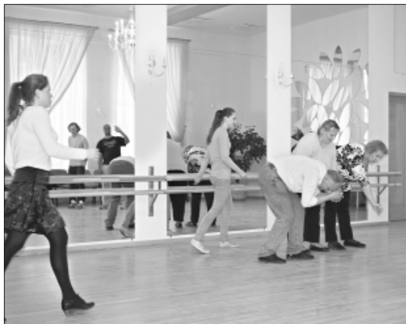
Piedalās meistarklasē. Balvu teātra studijas "Kabitelis" dalībnieces improvizācijas meistarklasē. Meitenes atzīst, ka nodarbības atmosfēra bija brīva un atraisīta, tādēļ sākotnējā nervozitāte drīz vien pagaisa bez pēdām.

Atšķirībā no Balvu jaunietēm, Gulbenes un Madonas amatieru improvizā-