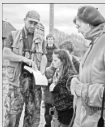
Ornitologi stāsta par putniem.