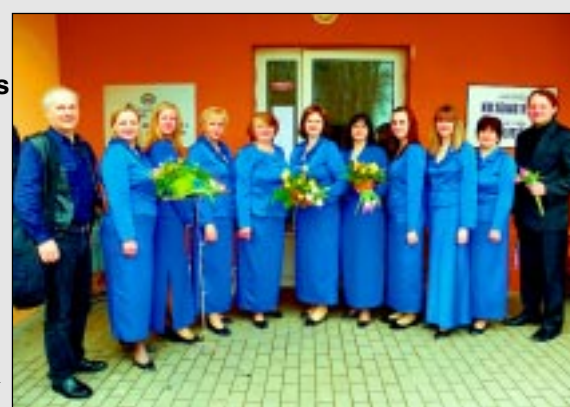
Dzied Riebiņu novadā.