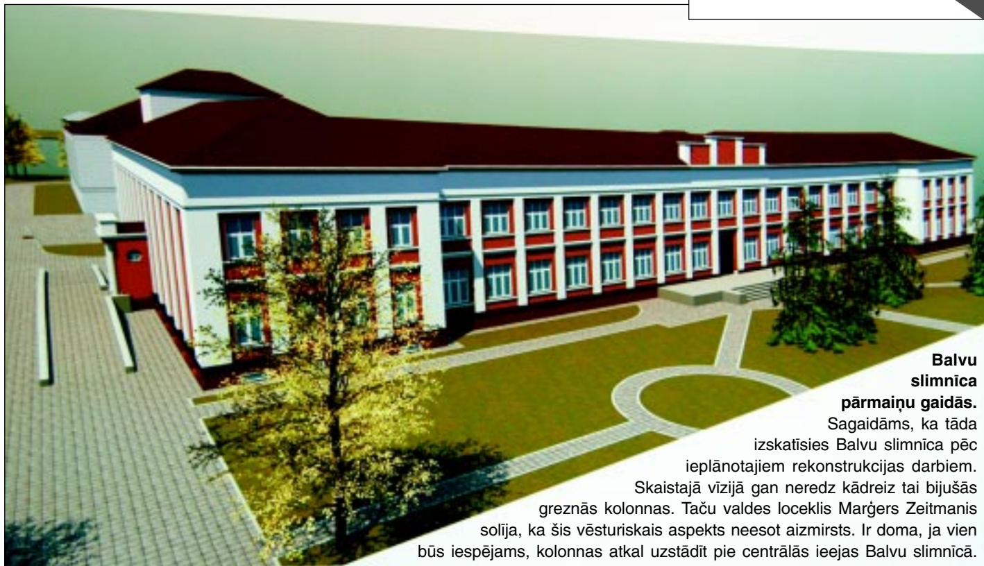
Balvu slimnīca pārmaiņu gaidās.

Nākamais laikraksta "Vaduguns" numurs iznāks 3.maijā.