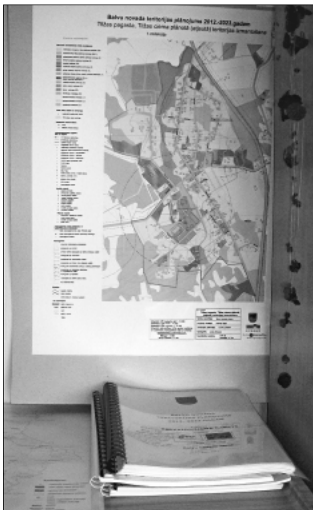
Sabiedriskās apspriešanas laikā ikvienam interesentam bija iespēja iepazīties ar teritoriālo plānojumu novada bibliotēkās.