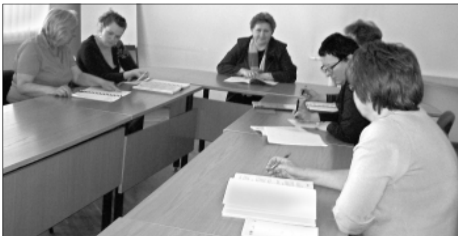
Attīstības programmas darba grupas sanākums.