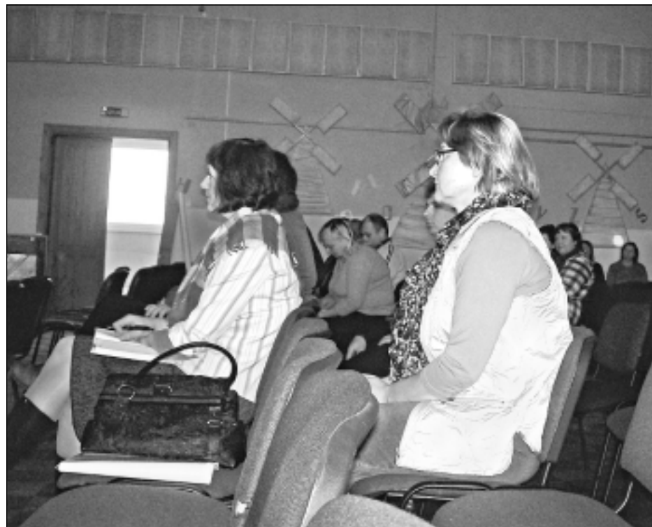
Teritorijas plānojuma sabiedriskā apspriešana Tilžā.