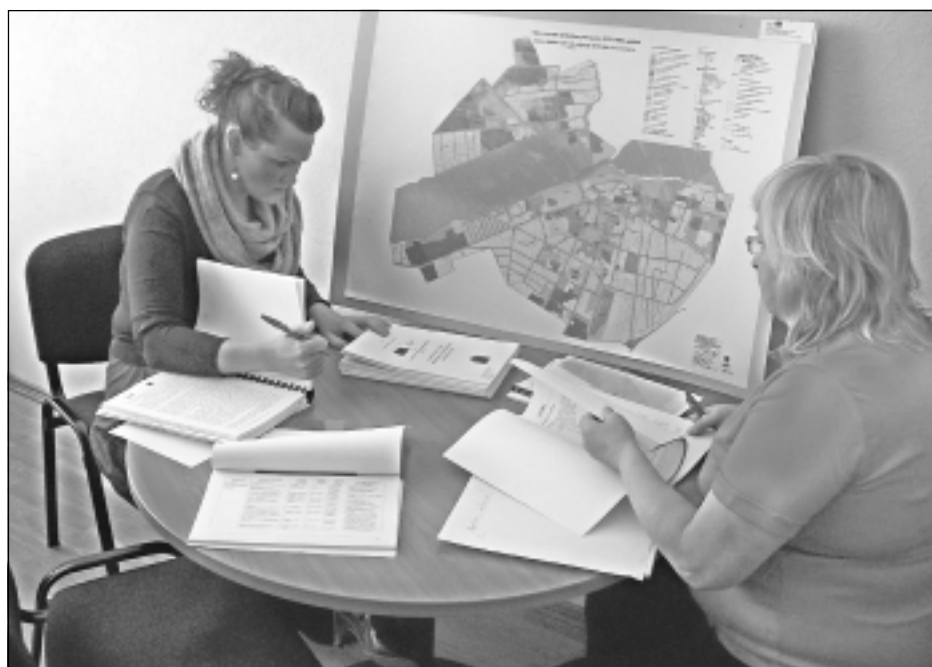
Teritorijas plānojuma gala redakcijas dokumentu pārbaudīšana.