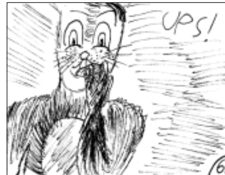
... lai kā arī zaķi to vēlētos.