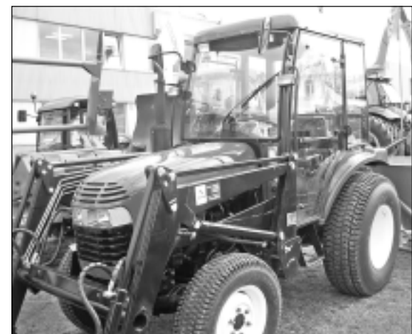
Moderna tehnika. Tehnikas laukums ar dažādu firmu pārstāvētajiem ražojumiem jo sevišķi "pievelk" lauku uzņēmējus.