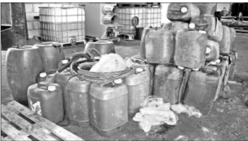
Degvielas kannas. Marta beigās Balvos iznīcināja 992 litrus kontrabandas degvielas. Uzņēmumam ir līgums, kas atļauj gadā iznīcināt ap 60 tūkstošiem litru degvielas.

to degvielu uzņēmēji lielākoties izmanto kurināšanai.