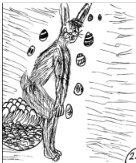
Runā, ka Lieldienu zaķi prot dēt olas.