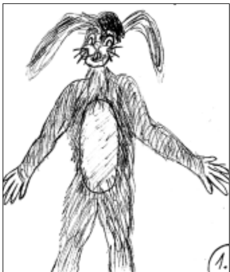
Kopš seniem laikiem pastāv atklāts jautājums par zaķa fizioloģisko uzbūvi.