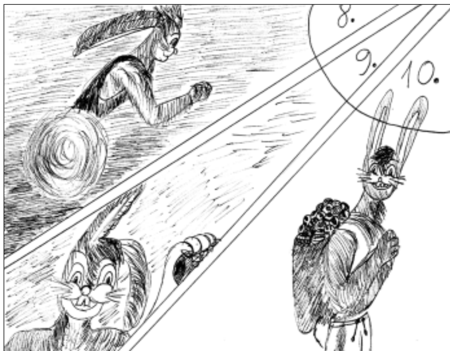
Taču zaķi spēj pārvietoties ar gaismas ātrumu. Un vēl tie prot labi paslēpt olas un citus priekšmetus, tieši tādēļ zaķi izvēlēti par kurjeriem olu piegādei Lieldienās!