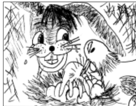
Ir atklāts tas, ka zaķi nedēj olas. Olas dēj vistas.