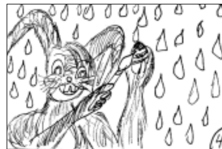
Zaķi neprot krāsot olas.