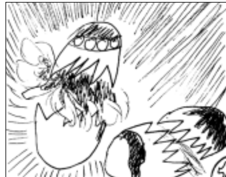
Viņiem tas nekad nav paveicies...