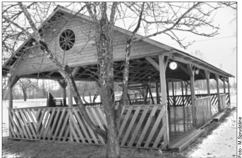
Mājas pagalmā. SIA "Sita Garden" īpašumā ir zeme, mežs, kā arī ļoti rūpīgi un skaisti izkopta, no senčiem mantota mājvieta. Dergači ir samainījuši dzīvesvietu Rīgā pret Sita. Šurp nedēļas nogalēs brauc arī abu dēlu ģimenes ar mazbērniem. Laukos visiem ļoti patīk. Iespējams, kādreiz SIA piedāvās arī tūrisma pakalpojumus. Te ir diķi, zivis, aug arī "Draudzības parks" - draugu un paziņu stādīto kociņu parks aiz pirts.

Bērnu priekam. Bērnu rotaļām iekārtota ne vien istaba mājā, bet arī šie simpātiskie āra slidkalniņi.