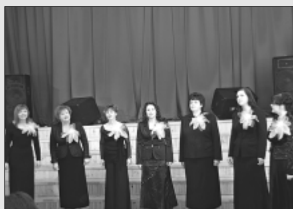
Žiguros aizvada vokālo ansambļu skati.