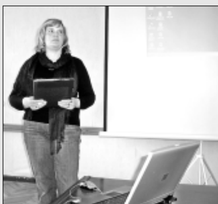
Atbild uz lauksaimnieku jautājumiem.