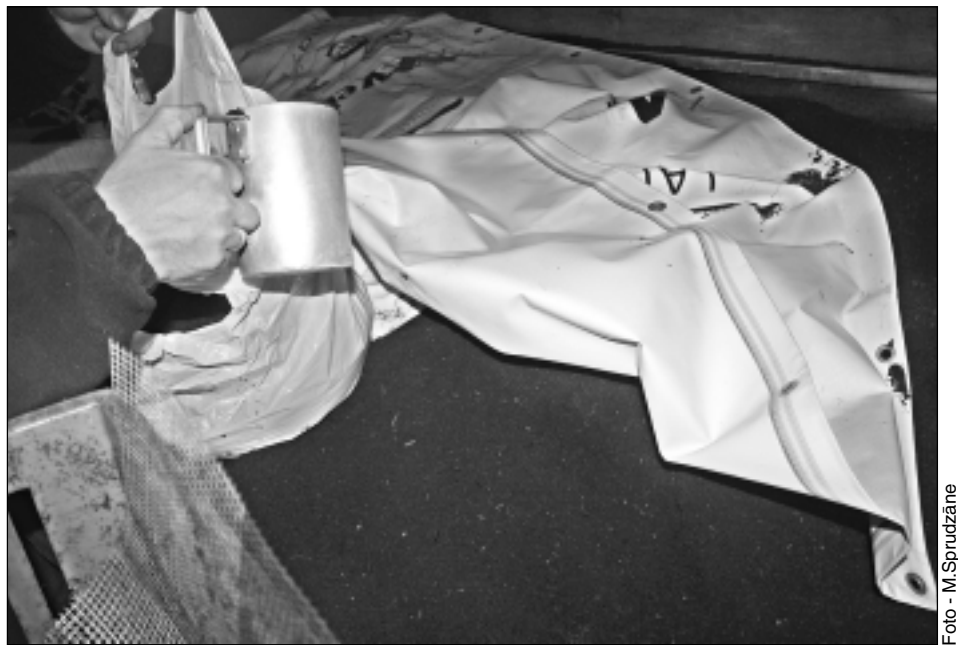
Gatavs lietošanai. Slieku biohumuss ir gatavs pēc aptuveni četriem mēnešiem. Sliekas kastē strādā divus mēnešus, vēl divus mēnešus turpinās mikroorganismu iedarbība. Pēc tam šo masu izsijā, tā nostāvas, līdz visbeidzot dabū smalku biohumusu – tumšu, smalku masu bez jebkādas smakas.