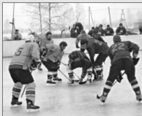
Lazdukalna hokejs - dzīvesstils.