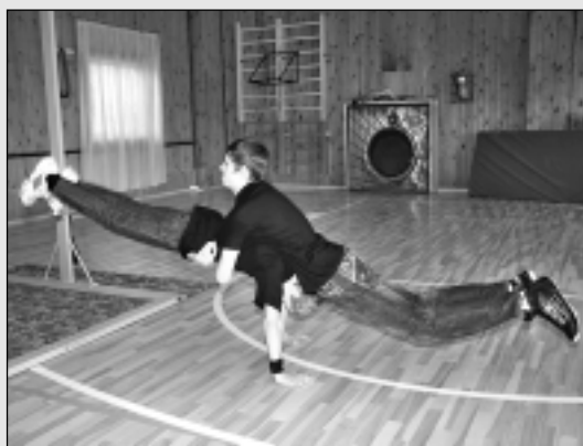
Ielu vingrošana nav sports, bet dzīvesveids.