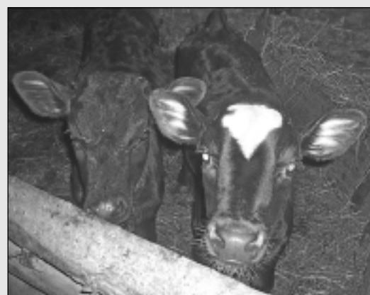
Govs dviņubērni - Prince un Princis.