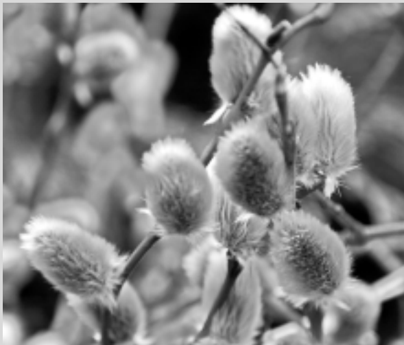
Brīvbrīdi sagatavoja A.Socka