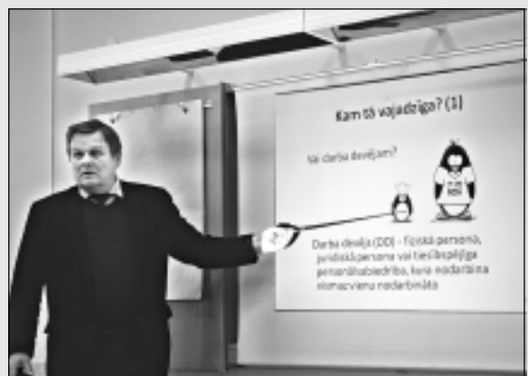
Skaidro darba drošības normatīvos aktus.