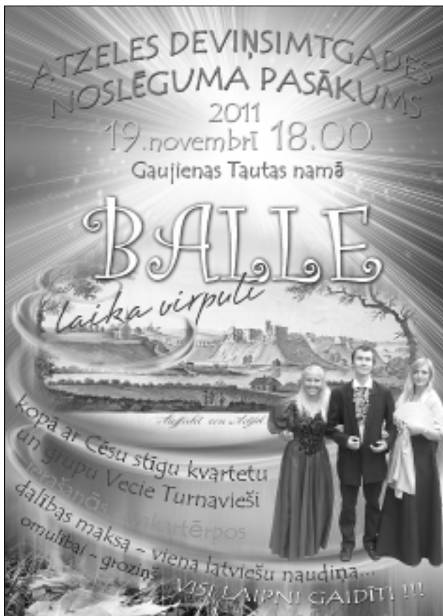
Pasākuma afiša. Sestdien, 19. novembrī, Gaujienā notiek Atzeles 900 gadu pasākuma balle, kurā tiek gan Atzeles apceļotāji, gan tūrisma objektu saimnieki. Ballē apbalvos arī konkursu uzvarētājus un prezentēs jauno Gaujienas kalendāru. Balle ir atklāta, - laipni lūgti visi, kas vēlas!

"Patiesība par latgaļiem nav mazāk svarīga par patiesību, kādu zinātne meklē pie inkiem, ēģiptiešiem, tibetiešiem, ebrejiem un citām senām kultūrtautām. Senās Purnovas atklāšana būs tā verta!" ar šādiem vārdiem savu pētījumu nobeidz A. Slišāns.