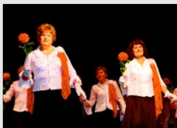
Eiropas deju kopas satiekas Balvos.