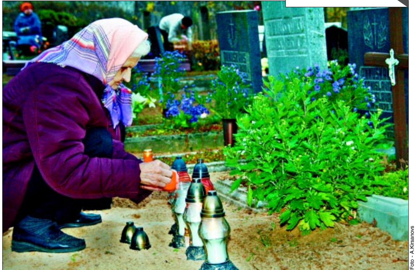
Iedez svēciti. Mirušo piemiņas dienā savus Začu kapos guldītos tuvīņiekus, iedezot svēcites un skaitot lūgšanas, pieminēja ne viens vien balvenietis.

● Vai psihiatra kabinets Balvos būs slēgts? Reformas ceļš