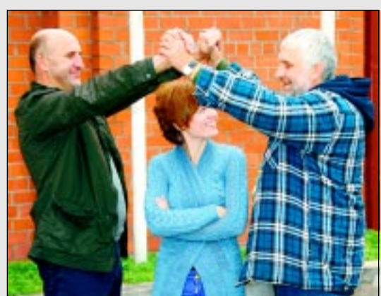
Piedalās rotaļā un ideju spēlē.