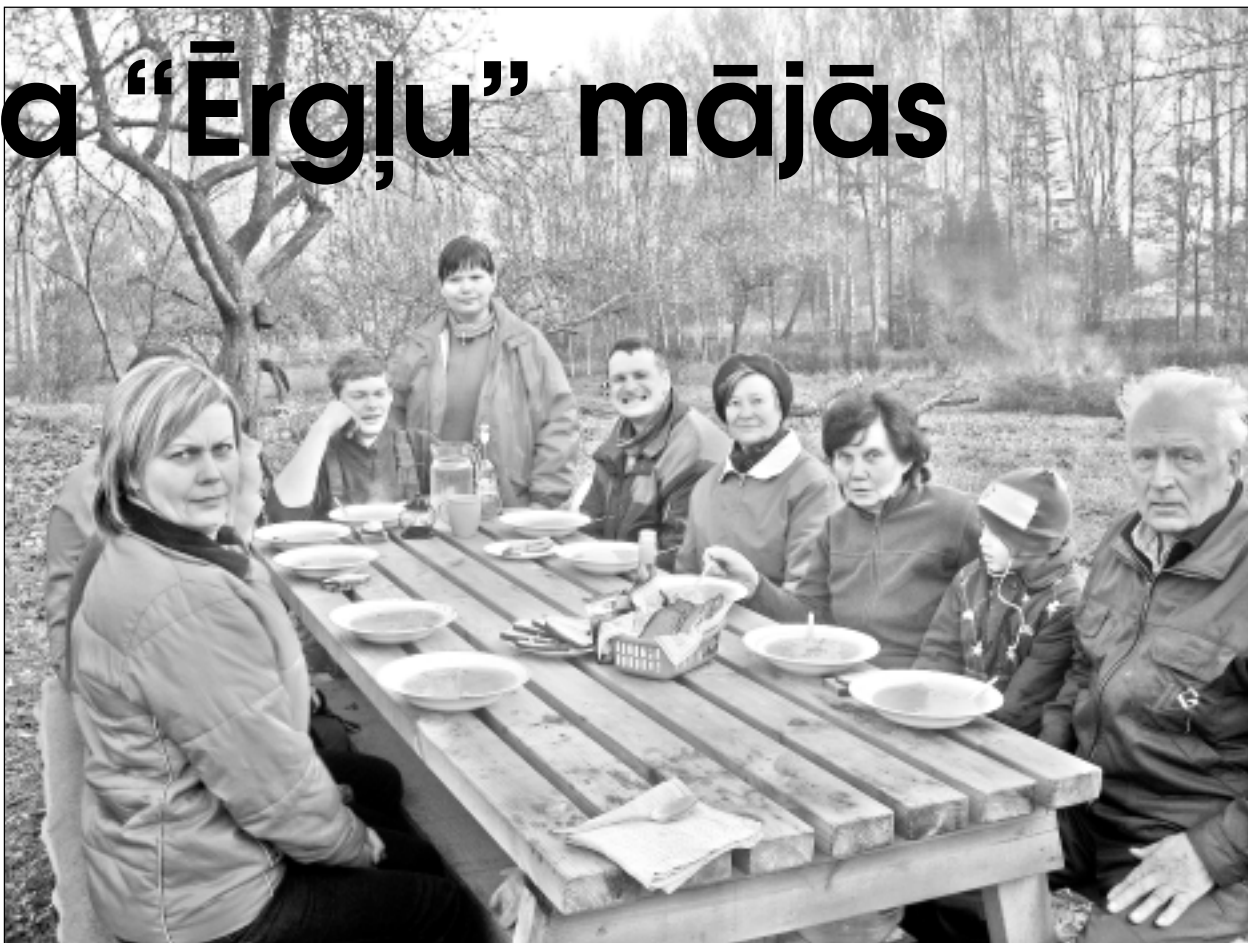
Pie galda. Uzklāj galdu, uz kura jābūt mājās ceptai maizei, un aicina talciniekus pusdienās. Talkas zupas izdošanās nosacījumi: vienmēr jāgatavo un jāēd svaigā gaisā! Pie galda nedrīkst iztrūkt smieklī un jautras sarunas!