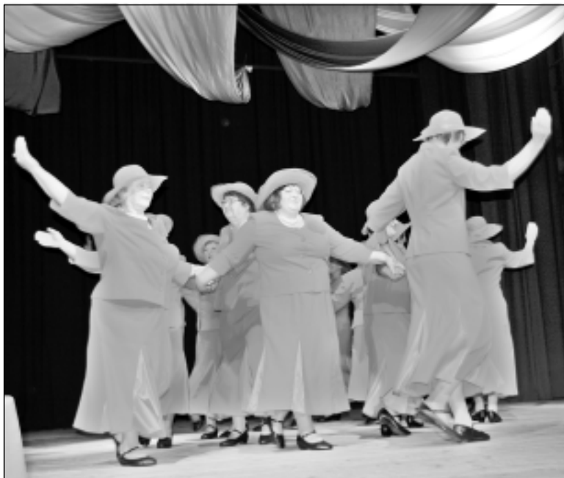
Iedanco sestajā gadiņā. Rugāju novada, Lazdukalna pagasta deju kopa "Tonuss".