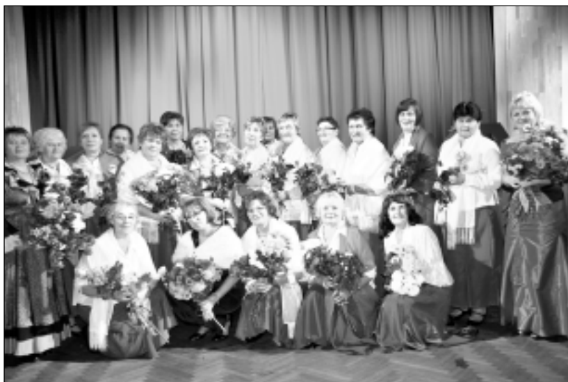
Svētku noslēgumā. "Atvasaras" deju kopā ar vakara vadītājiem un draugiem.