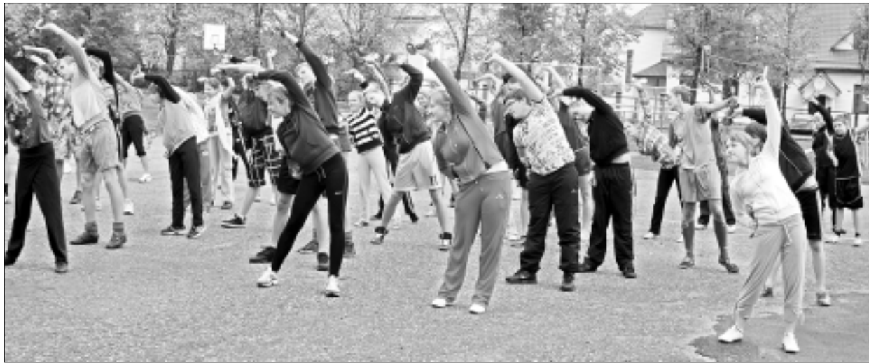
Rīta vingrošana. Tā sākās pulksten 10 visā Latvijā. Jaunie sportisti Balvos (foto) rūpīgi klausījās radio SWH, kas atskaņoja piecas minūtes garu vingrojumu kopumu: pacelt rokas, notuities u.t.t.