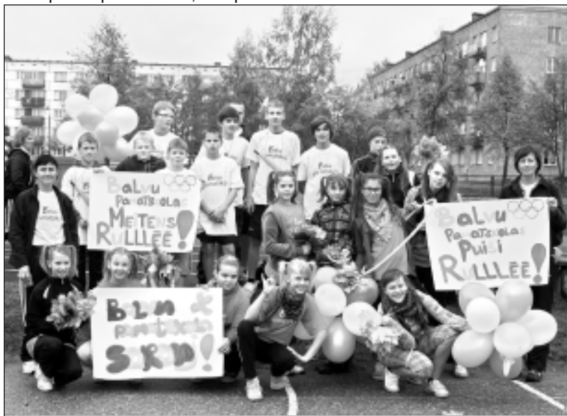
Ar taurēm, baloniem un smaidiem. Jau pusstundu pirms Olimpiskās dienas oficiālās atklāšanas Balvu Valsts ģimnāzijas stadionā sevi pieteica Balvu pamatskolas komanda, kura bija parūpējusies gan par formas tērpiem, gan par plakātiem, taurēm un baloniem.

Vakar pie Balvu Valsts ģimnāzijas notika nebijis pasākums – Olimpiskā rīta vingrošana. Kā jau Olimpiādē pienākas, neizpalika ne Olimpiskā karoga pacelšana, ne svinīgas uzrunas un, pats svarīgākais - spraigas sacensības.