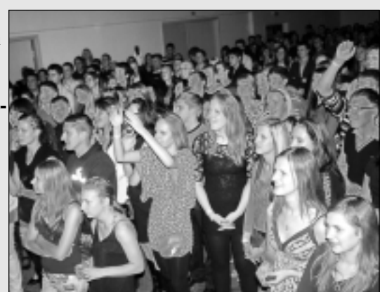
Baltinavā atpūšas jaunieši.