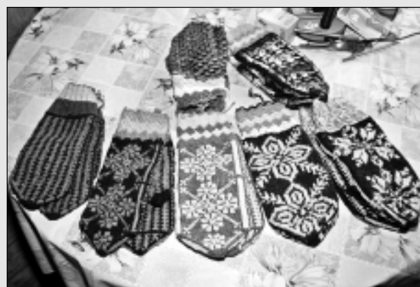
Tilžas pagastā dzīvo čaklas rokdarbnieces.