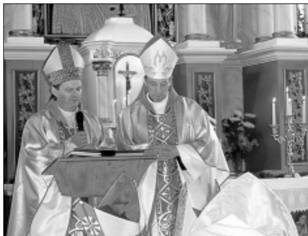
Spreidķis. Baznīcas apmeklētāji ieklausījās sprediķī un ar prieku vēroja biskapus, īpaši mūsu arhibīskapu-metropolītu Zbigņevu Stankeviču (no labās).