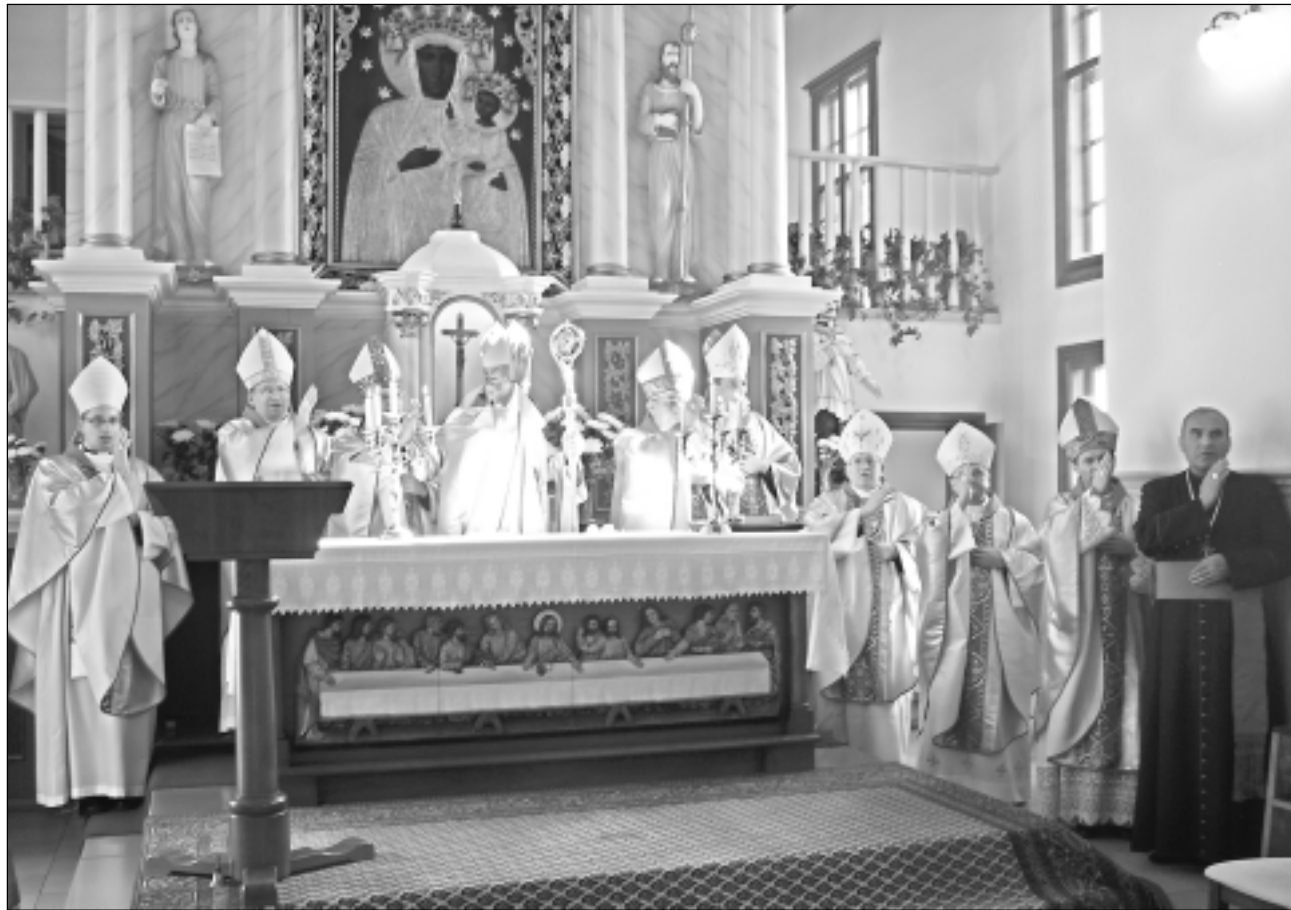
Dod svētību. Biskapi deva svētību klātesošajiem, Rēzeknes-Aglonas diecēzei un Latvijai.