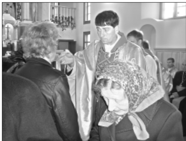
Saņem svēto Komūniju. Pirms dievkalpojuma daudzi ticīgie izsūdzēja grēkus mūsu draudžu priesteriem, lai pienācīgi piedalītos svētajā Misē un saņemtu svēto Komūniju.