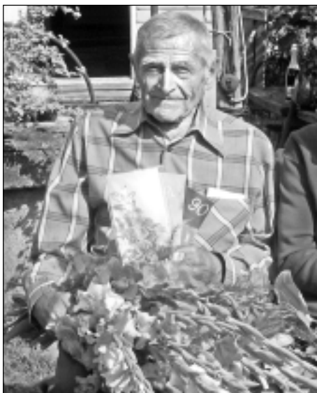
Gandarīts. Jubilārs savā apaļajā jubilejā bija gandarīts gan par sveicējiem, gan jauko atmosfēru - rotaļām un dziesmām akordeona pavadībā.