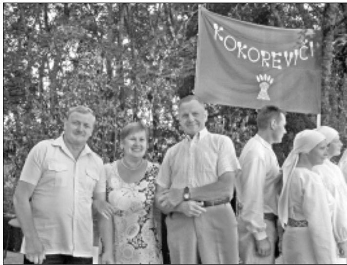
Kokoreviču salidojums. Lieliska iespēja satikt radus un bērnības draugus ir Kokoreviču saietā.