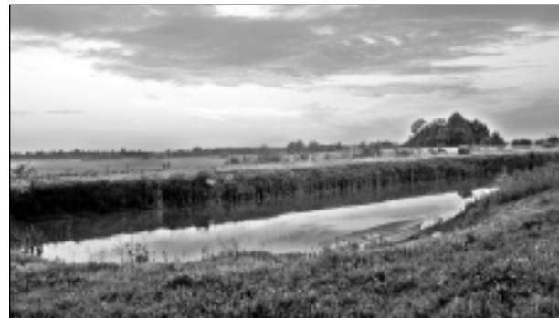
Vakarpusē. Iesūtīja Liene Circene.