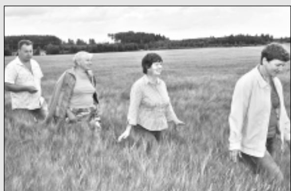
Inspektori ciemojas „Kotiņos”