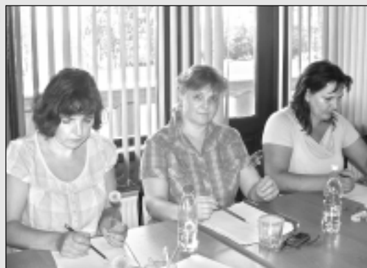
Piedalījās nodarbībās, peldējās ezerā, dziedāja un atpūtās.