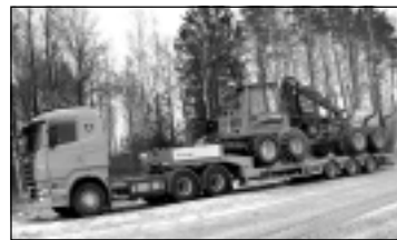
Treilera pakalpojumi. Tālr. 29113399.

Tālāka ārstēšana pie profesora J.Ķīša Rīgā, F. Sadovņikova ielā 20, 214. kabinets, tālrunis 28699111. Vairāk informācijas - http:// www.dermatologs.com .