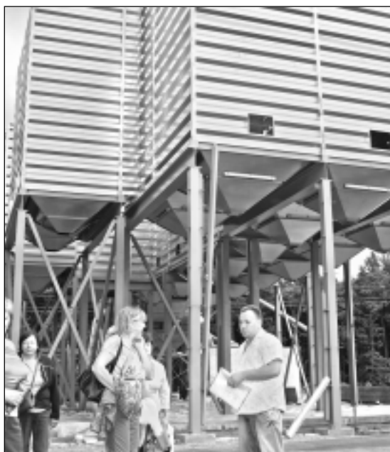
Atkal jauna būve. Zemnieku saimniecības ražošanas laukumā atkal pārvērtības. Izrakti un sabetonēti pamati, uzstādītas konstrukcijas, top jaunas graudu noliktavas – bunkuri. Pirmie pieci būs graudu pieņemšanas bunkuri, tālāk izvietota graudu pieņemšanas bedre, no kuras labība aizceļos uz kaltēm, ko saimniecībā apkurina ar šķeldu.