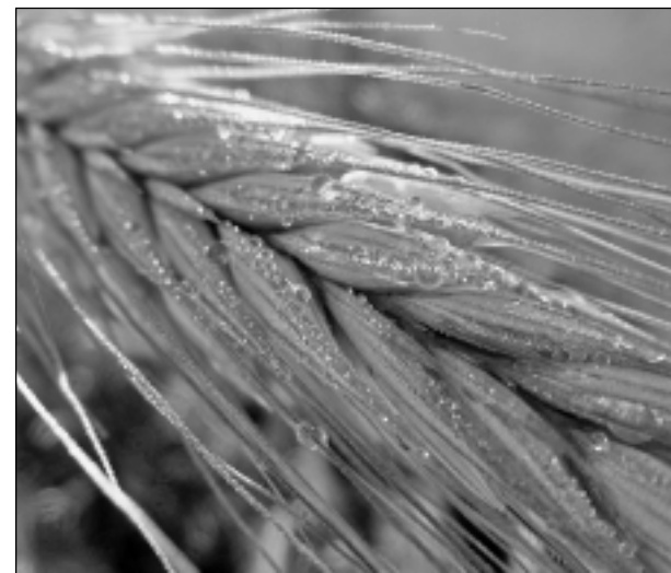
Raža. Iesūtīja Liene Circene.