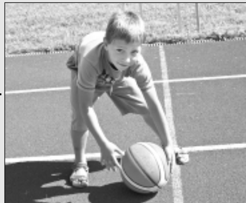
Atraktīvi svētki Tilžā.