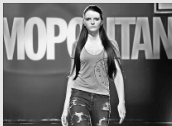
Piedalījās konkursa „Mis un Mistery Latvija 2010” finālā.