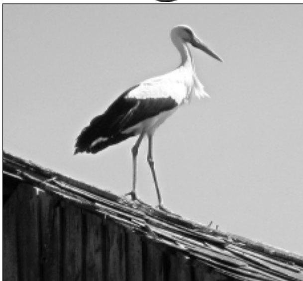
Svētelis. Iesūtīja Anda Bērziņa no Balviem.

Katra mēneša labākās fotogrāfijas autors balvā saņems žurnālu komplektu. Jūlija tēma "Silta, jauka vasariņa". Fotogrāfijas var iesūtīt pa pastu - Balvi, Teātra ielā 8, LV-4501, vai elektroniski - vaduguns@apollo.lv. Pie foto obligāti norādāms vārds, uzvārds (vēlams - tālrunis).