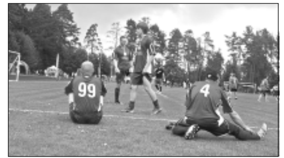
Pirms spēles. "Īves" gatavojas spēlei.