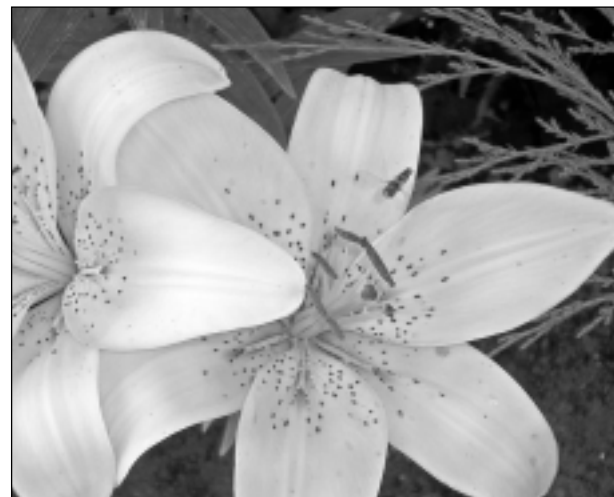
Kas dārzā, kas dārzā. Iesūtīja Santa Kaļāne.