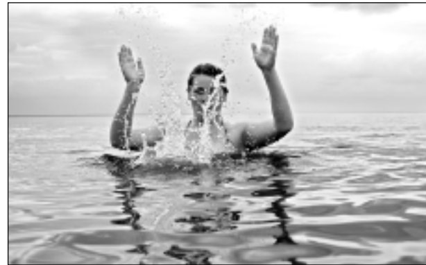
Ūdens pavēlniece. Iesūtīja Rita Keiša.