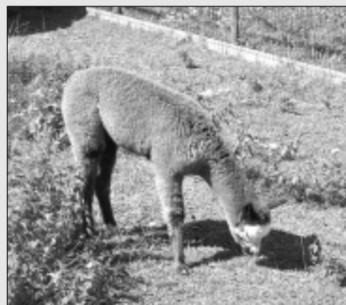
Iepazīstiet Krāslavas novada daudz - veidību.