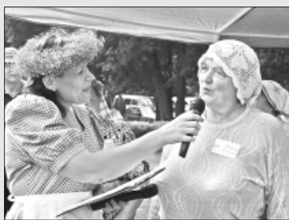
Viļakā svin maizes, siera un alus svētkus.