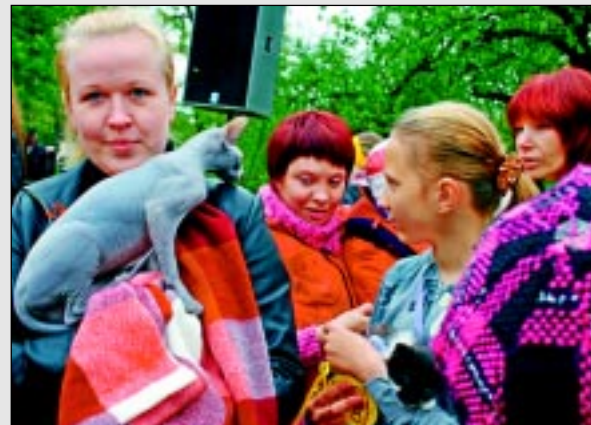
Iepazīstinām ar Ukrainas Lefkojs šķirnes kaķi.