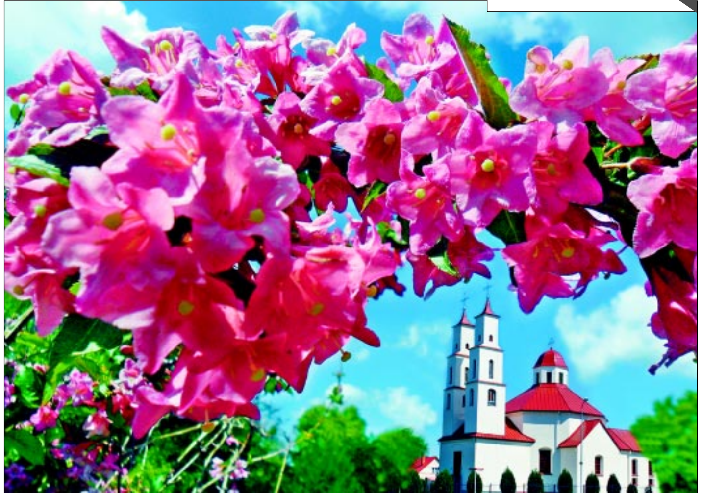
Vasarsvētku noskaņa. Svētdien mājai jābūt izpušķotai ar meijām un puķēm. Vajag aiziet uz baznīcu, jo tas nes svētību turpmākajiem ikdienas darbiem un pacilā garu.

14. jūnijā pulksten 11 atceres pasākums notiks arī Rugāju skvērā.