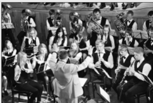
Tautas pūtēju orķestris "Balvi" ar koncertu piecē jubilejā.