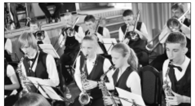
Skan saksofoni un tromboni. Orķestri ir četrpadsmit saksofonu spēlētāji, bet tromboniem skanēt liek seši mūziķi.