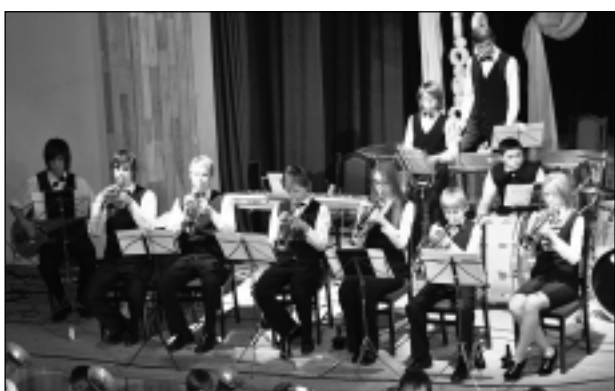
Fragments no trompetes un sitaminstrumentu grupas spēlētājiem. Trompetes orķestri spēlēja divpadsmit mūziķi, bet sitaminstrumentus- seši mūziķi.