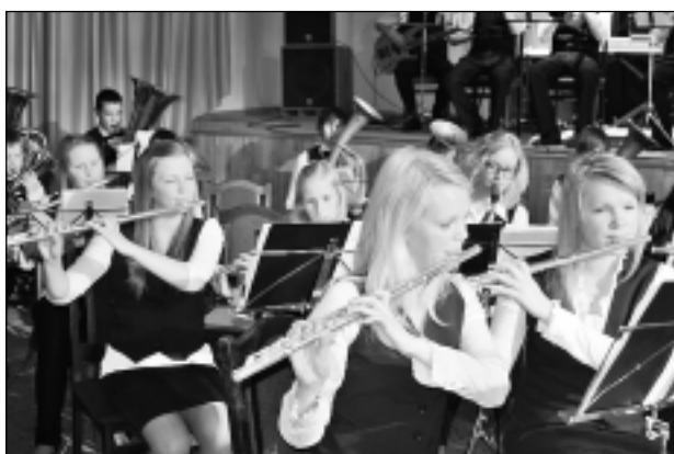
Daļa no flautu spēlētāju grupas. Pavisam orķestri skanīgas stīgas ievij astoņu flautu skaņas.