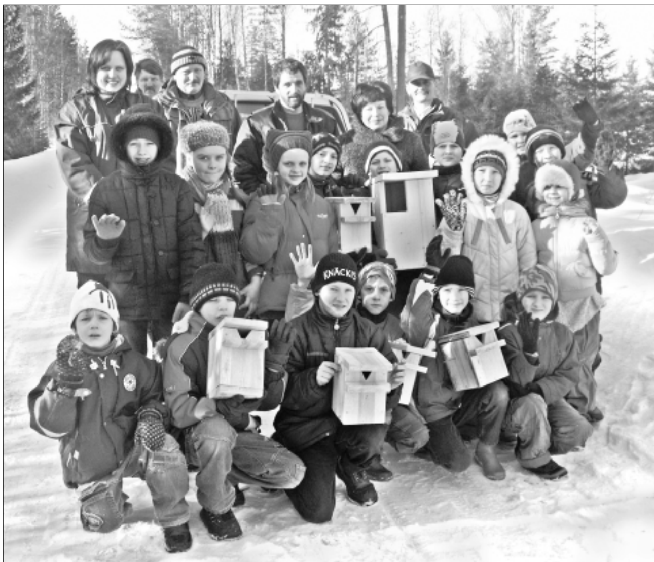
Rugāju novada vidusskolas 3.klases skolēni. Viņi mežā ieklausījās gan putnu balsis, gan mežniecības darbinieku stāstījumā un aktīvi iesaistījās arī putnu būrišu gatavošanā un izlikšanā. Tas palīdzēs tuvāk izprast dabā notiekošo, saudzēt un rūpēties par visu dzīvo.