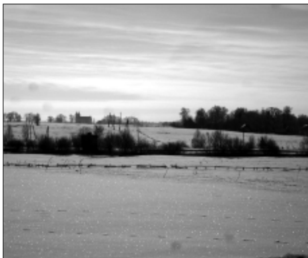
Ziemas ainava.

Katra mēneša labākās fotogrāfijas autors balvā saņem žurnālu komplektu. Marta tēma - "Pavasari gaidot". Fotogrāfijas var iesūtīt pa pastu - Balvi, Teātra ielā 8, LV-4501, vai elektroniski - vaduguns@apollo.lv. Pie foto obligāti norādāms vārds, uzvārds (vēlams - tālrunis).