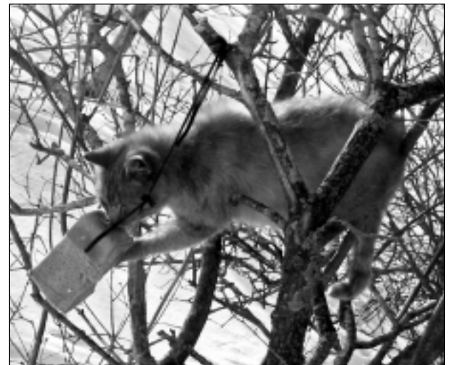
Maltīte. Iesūtīja Rudīte Šapale no Lazdukalna.