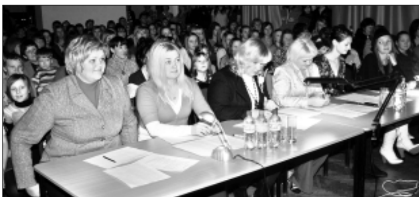
Žūrija. Šoreiz žūrijas sastāvā piedalījās ne vien Balvu un Viļakas novada pārstāvji, bet arī modes un deju speciālisti no Gulbenes. Arī darba žūrijai šogad bija vairāk nekā pērn, jo konkursā pieteicās par desmit dalībniekiem vairāk. Turklāt pieaudzis arī priekšnesumu žanru klāsts. Tomēr, spriežot pēc piešķirto 1., 2. un 3. pakāpju daudzuma, talantīgu bērnu novadā joprojām netrūkst.