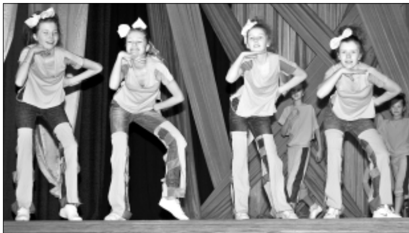
"Rozīnītes". Deju studijas Di Dancers deju grupas "Rozīnītes" dalībnieces kā vienmēr uzstājās pārliecinoši, izpelnoties žūrijas augstāko vērtējumu. Meiteņu izpildījumā skatītāji vēroja deju "Mātes un meitas".