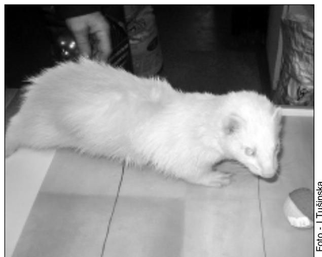
Lappusi sagatavoja I.Tušinska

"Izvērtējot šo un daudzus citus gadījumus, var secināt, ka situācija ar pazudušiem dzīvniekiem ir aktuāla, jo ik dienas pilsētas ielās var redzēt noklīdušus dzīvniekus. Pašlaik vienīgā iespēja, ko piedāvā atbildīgās iestādes, ir dzīvnieku iemidzināšana. Tāpēc, lai arī dzīvniekam dotu iespēju dzīvot un atrast mīlošu, gādīgu saimnieku, ir nepieciešama dzīvnieku patversme. Ne vienmēr cilvēkiem ir vēlme un iespēja palīdzēt svešiem dzīvniekiem, tāpēc lielu paldies var teikt veterinārārstei, kura nesavtīgi sniedza bezmaksas palīdzību noklīdušajam sunim. Taču vēl joprojām aktuāls paliek jautājums – ko darīt ar dzīvniekiem, kas palikuši bez saimnieka... atstāt likteņa varā?... Iemidzināt?... Vai dot iespēju dzīvot?" jautā noklīdušā sunīša atradēja.