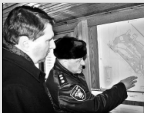
Apspriež "Vientuļu" nākotni.