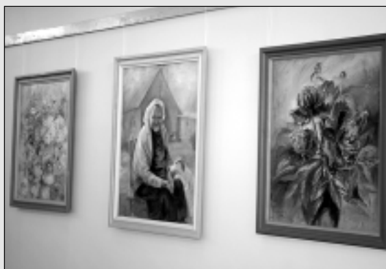
Balvu Novada muzejā skatāmas mākslinieču O. Rečes un E. Teilānes darbu izstādes.