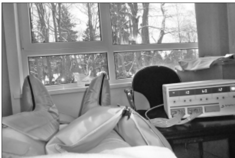
Fizikālās terapijas kabinetā. Kliente izbauda procedūru, kas saucas "limfodrenāžas zābaki". Tā ir masāža ar mainīgu gaisa spiedienu, rezultātā uzlabojot asinsriti un limfas plūsmu.

Lai saņemtu SIVA pakalpojumus, iedzīvotājiem jāgriežas savas pašvaldības sociālajā dienestā, kur viņiem jāaizpilda rakstisks iesniegums un jāiesniedz ģimenes vai ārstējošā ārsta izdota izziņa. Pēc tam pašvaldības sociālais dienests pie-