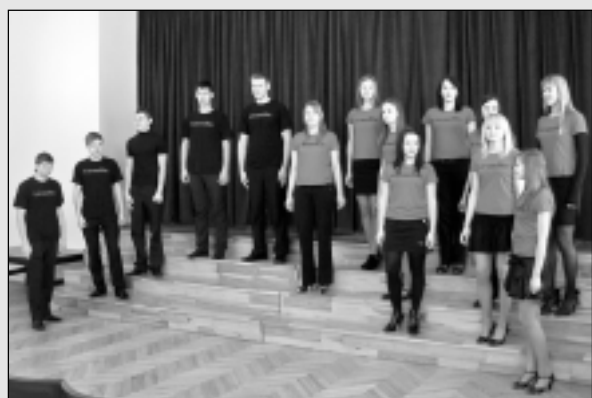
Aizvada vokālo mūzikas konkursu "Balsis".

● Pasniedz "Boņuka" balvas Sumina mūsējos