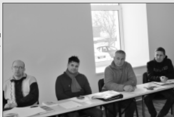
Rīko semināru uzņēmējiem.