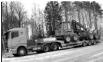
Treilera pakalpojumi. Tāl. 29113399.

25.janvārī pulksten 17 uzņems B; BC; C; CE; D kategoriju un 26.janvārī pulksten 17 uzņems profesionālo autovadītāju apmācību kursus, lai iegūtu sertifikātu PROFESIONĀLAIS autovadītājs un apmainītu vadītāja apliecību ar atzīmi - 95. profesionālo kodu, bez eksāmeniem. Tāl. uzziņām: pasniedzējam 28700807 , autoskolai 29267227 .