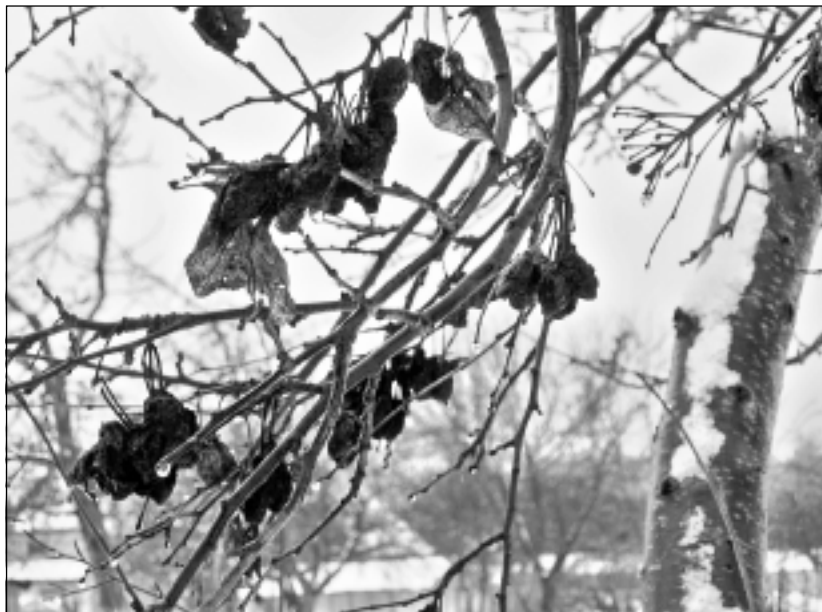
Puve. Augļu parastā puve plūmēs.

Pašreiz sasnīgusi sniega sega liecina, ka uz augsnes uzkrājušās lielas ūdens masas - tas mudina pārlūkot meliorācijas kolektoru izvadus, notekūdeņu akas, vai tās nav aizsērējušas. Dati meliorācijas sistēmām mājaslapā http://www.melioracija.lv . Ilgstošas ūdens peļķes augļu dārzā negatīvi iedarbojas uz augļu koku potcelmiem un bojā tos, veicinot sakņu kakla puves attīstību. Ilgāku laiku uz augļu koku zariem Austrumlatvijā bija ledus kārtiņa, kura smaguma ietekmē radījusi mikroplaisas zaru miziņā. Šodien teikt, ka augļu koku kaitēkļu ziemojošās stadijas būs gājušas bojā, ir pārāgri, jo zinām, ka kaitēkļu - ābeļu zaļo laputu, ābeļu lapu blusīņu, augļu koku sarkanās tīklērces u.c. kaitēkļu ziemojošās stadijas izvietotas, nodrošinot izdzīvošanu arī ārkārtējos apstākļos uz augļzariņiem to rievīnās. Pie tam to parasti ir vairāk zariņu apakšējā daļā, mizu spraugās un citās slēptuvēs. Apledojuma vietās bremsēta mizas elpošana. Pēc iepriekšējās 2009.-2010.gada