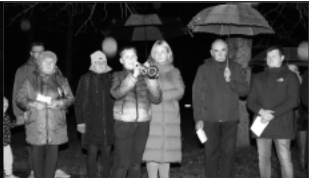
Svinīgs brīdis. Pirms krusta iesvētīšanas neizpalika muzikāls priekšnesums.