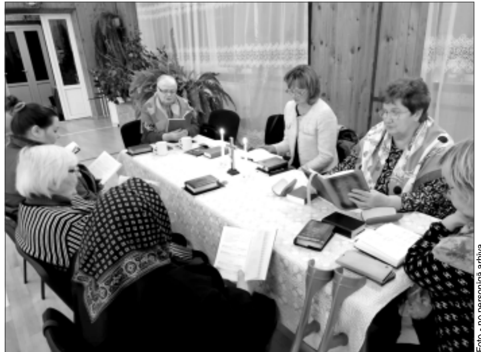
Vectilžā. Aizvadītajā nedēļā psalmus dziedāja astoņas sievietes. Pēc kopīgām lūgšanām un dziesmām viņas, kā ierasts arī citviet, parasti vēl pakavējas pie tases tējas.