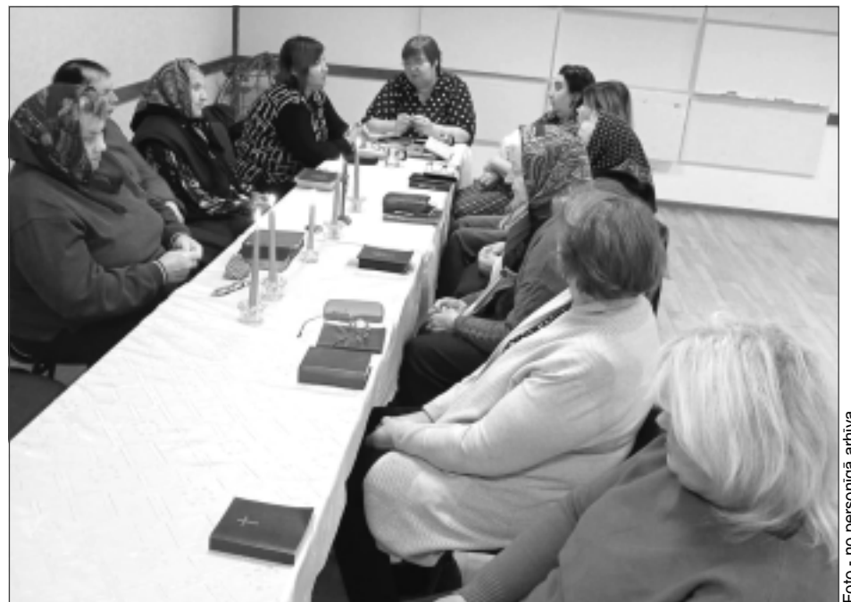
Lazdulejā. Psalmus dziedāja 12 sievietes, kura priecējās, ka nebija jādzied kā pagājušā gadā, vadoties pēc diska ieraksta. Psalmu dziedāšanai raksturīgi, ka tā lielākoties notiek pie baltiem klātiem galdiem, kur neiztrūkstoša sastāvdaļa ir lūgšanu grāmatas un iedegtu sveču liesmas, kas, līdzīgi kā lūgšanas, tiecas augšup. Uz psalmu dziedāšanas pasākumu daudzviet sievietes tradicionāli ierodas ar groziņu, lai pēc lūgšanām pie tējas tases un pašu sarūpēta cienasta pakavētos atmiņās un pārdomās.