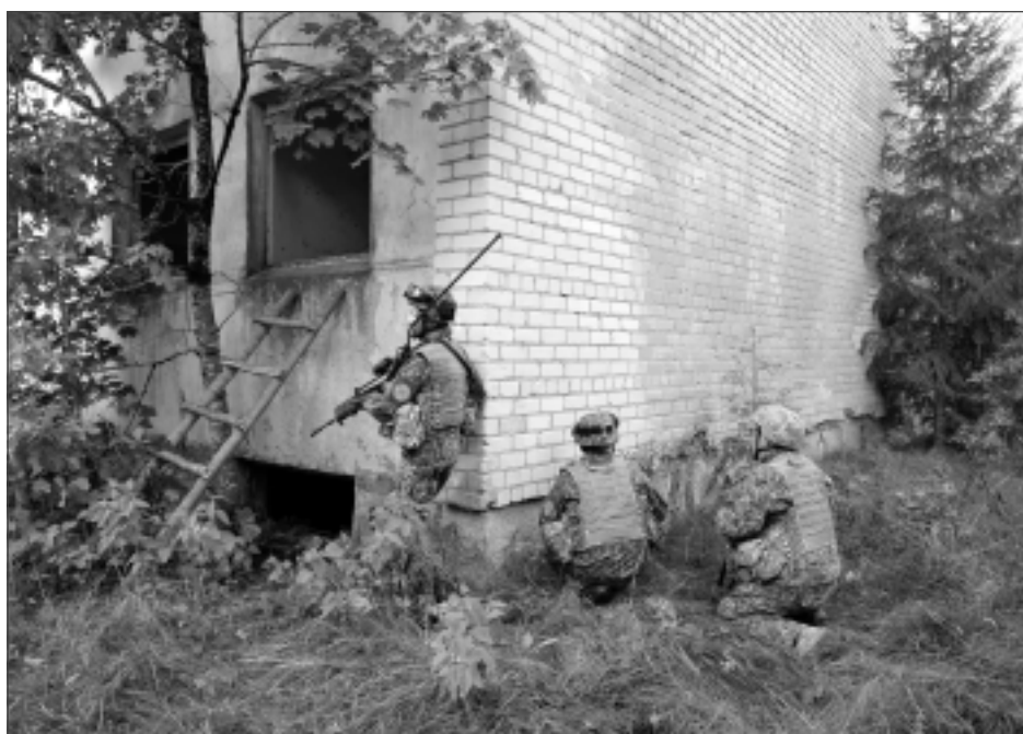
Objekta tīrīšana. Attēlā redzams, kā karavīri ieņem ēku, lai pēc mācību scenārija to atbrīvotu no pretinieka. Militārajā nozarē šādu operāciju dēvē par objekta tīrīšanu.

Mēs esam gatavi iestāties par savu valsti, novadu, pilsētu un ģimenēm. Sargāsim Latviju kopā!