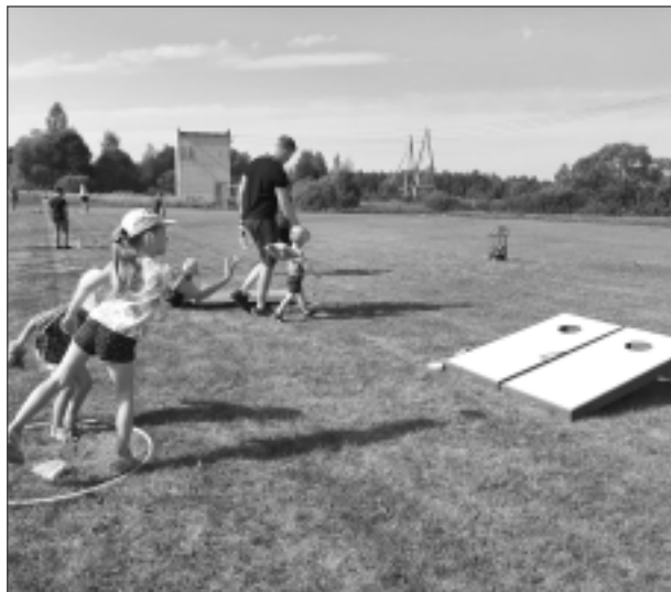
Prieks gan vecākiem, gan bērniem. Vectilžas pagasta sporta svētkos garlaicīgi nebija nevienam.