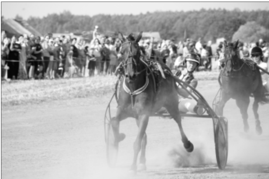
Vai guva adrenalīnu! Skatītāji un sportisti vienprātīgi atzina, ka guvuši gandarījumu, turklāt tik jaukā un saulainā dienā.