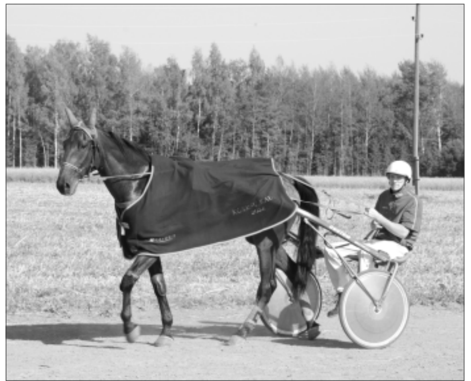
Ko saņēma uzvarētājs? Īpašu "Kotiņu" zirgsegu, kausu un 300 kg auzu, neskaitot citus "Kotiņu" gardumus un labumus.