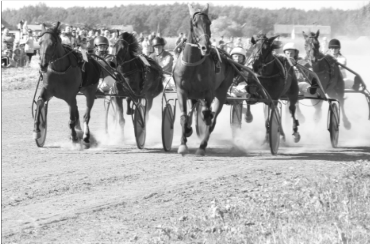
Finālbrauciens. Pirmajās rikšotāju zirgu sacensībās "Kotiņu kauss 2024" uz goda pjedestāla augstākajiem pakāpieniem kāpa lietuvieši. R.Zelča ierindojās 4.vietā.