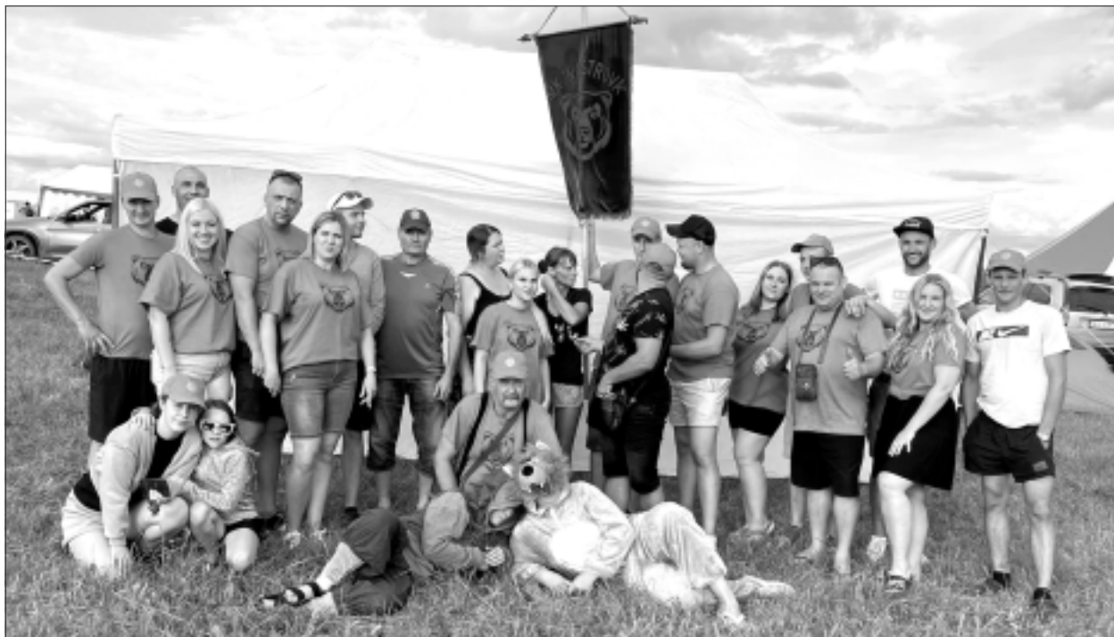
Smuku muižā. MK "Nastrova" mednieku festivālā "Minhauzens".

Vai festivāla dalībnieki sacentās disciplinās, kas ir noderīgas medībās?