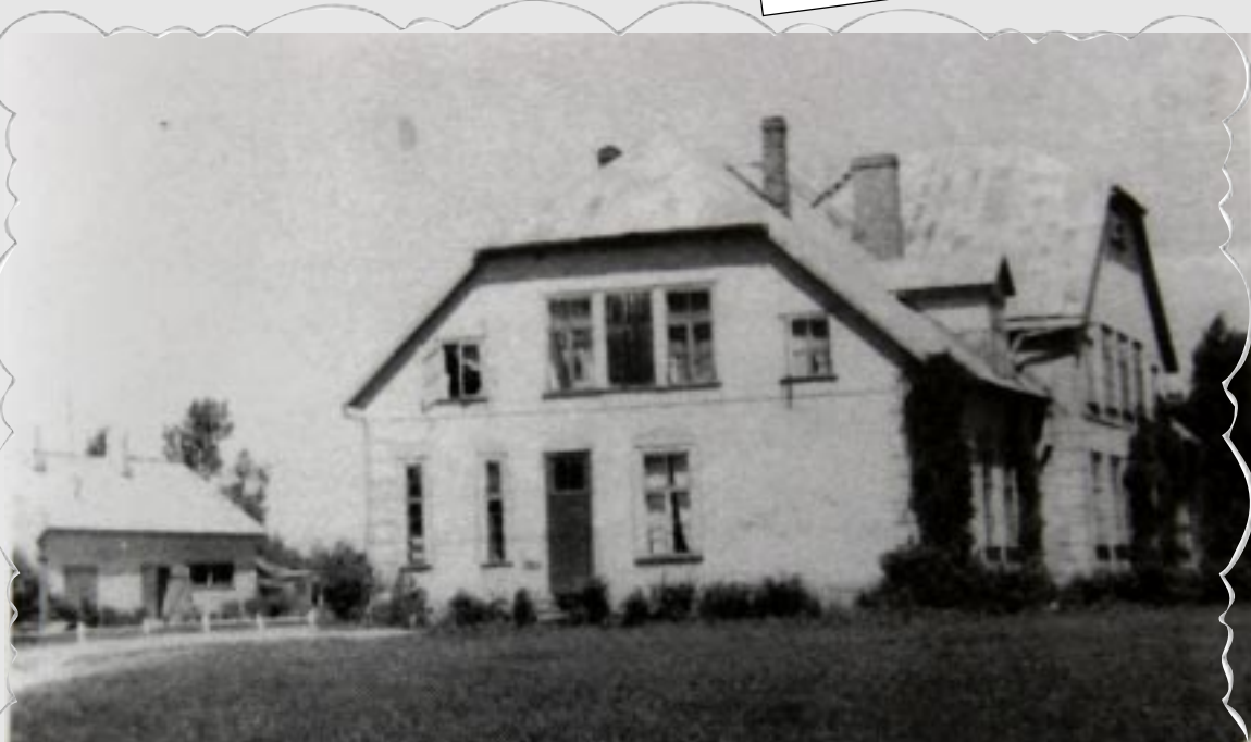
Jaunajā skolas ēkā mācības sākās 1925. gada 7.janvārī.

6 1965.gadā sākās skolas kapitālremonts – skolas pārbūve, saglabājot nepārbūvētu vidusdaļu.