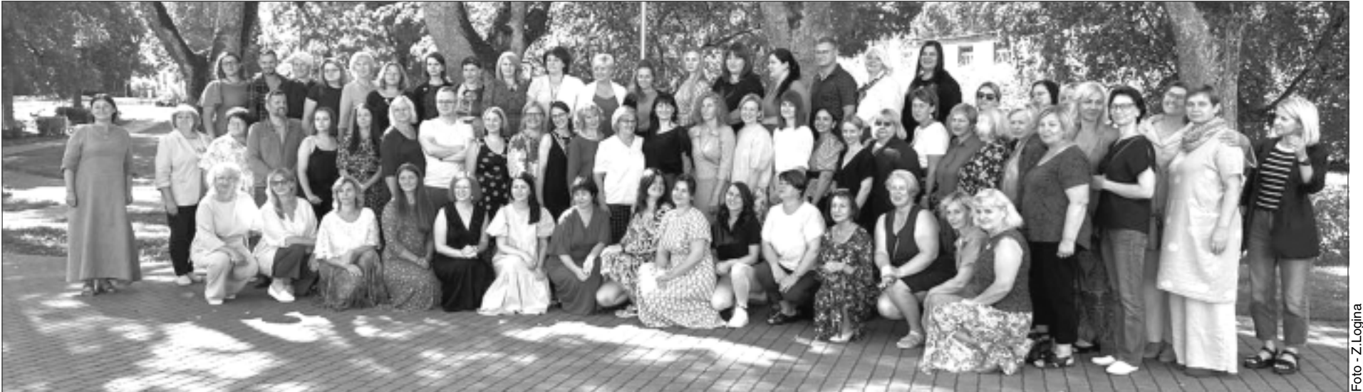
Trešā vasaras kultūras akadēmija Alūksnē. Alūksnieši bija rūpīgi gatavojušies un ar prieku uzņēma kultūras cilvēkus no visas Latvijas, arī Balvu novada.