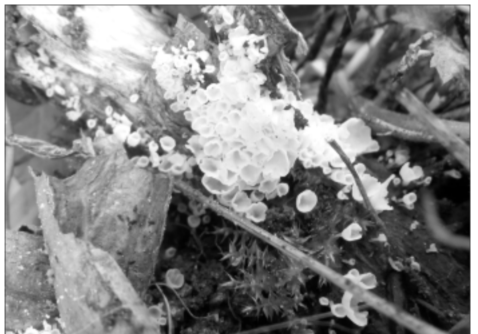
Atradums! A.Korņejevas atklātā sēne Calyptella capula .

(notiks gan sēņu, gan gleznu izstāde, darbnīcas, tiks demonstrētas filmas utt.). Mums tuvākais būs 7.septembrī Sēņu dienu pasākums Žiguru Meža svētkos. Tie ir tikai daži no šī rudens notikumiem, sekojiet informācijai sociālajos tīklos un citur. Mikologu biedrība šogad realizē izglītojošu pasākumu ciklu "Sēņu grozs" un "Sēņu dienas novados".