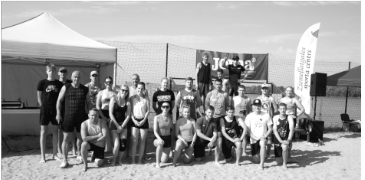
Paši aktīvākie. Vislielākās emocijas skatītājiem sarūpēja pludmales volejbolisti (foto).