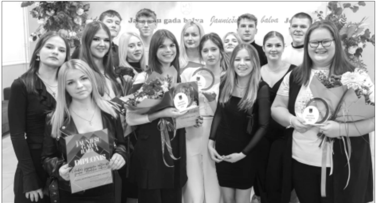
Viļakas jauniešu mājas aktivisti. Kopā gan rītos, gan vakaros kā viena kupla ģimene. Aktivisti, kuri ir parādījuši savu potenciālu, organizējot dažādus pasākumus un trenējot savas līderības prasmes vietējā kopienā.

– Jauniešu centrs spēlē svarīgu lomu, sniedzot atbalstu, iespē-