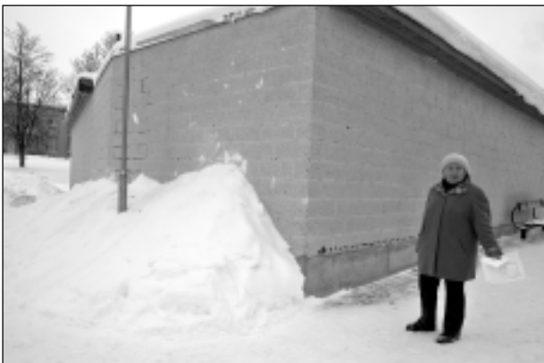
Pie autoostas. Sniega kupenas, kā uzskata mājas iedzīvotāji, bojā viņu īpašumā esošos šķūnišus un mantas, kas tajos atrodas.