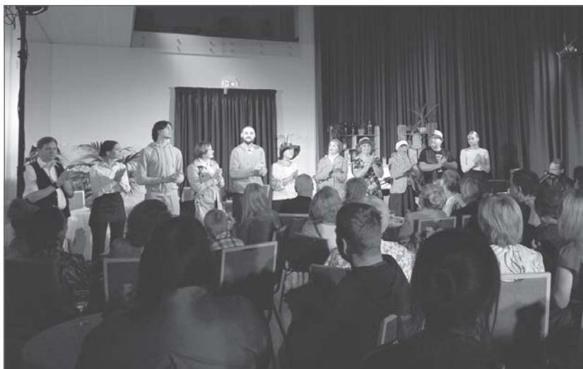
Patikams dienas noslēgums. Skatītāji secināja, ka izrāde "Mazpilsētas mazstāstiņi" bija lieliska, jo atspoguļo cilvēku ikdienu un realitāti, kas notiek gan mazpilsētās, gan lielajās pilsētās, kā arī gūst atziņu, ka arī laime ir vienkāršajās lietās.