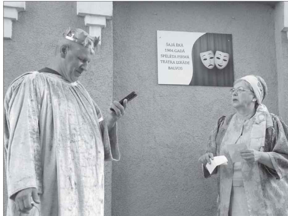
Atklāj piemiņas plāksni. Atklājot piemiņas plāksni vietā, kur 1904.gadā spēlēja pirmā izrāde Balvos, preciniece (foto) lūdza palīdzību, kur atrast izredzēto. “Varbūt karalis palīdzēs?” viņa sprieda. “Vēl jau var meklēt nākamos 120 gadus,” lietišķi paskaidroja karalis.