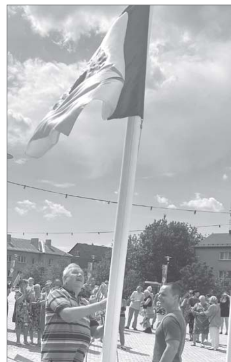
Nolaiž svētku karogu. Šo uzdevumu uzreiz pēc Valkas pilsētas teātra izrādes “Zvirbuļa ligzda” noskatīšanās uzticēja veikt iestudējuma režisoram un scenogrāfam Aivaram Ikšelim.