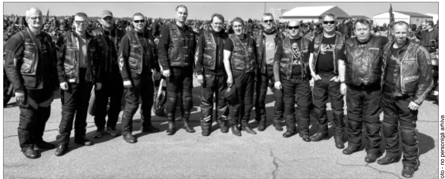
Motoklubs "Spieķi vējā". Attēlā redzami 12 motokluba biedri, kuri galvaspilsētā Rīgā motosezonu oficiāli atklāja līdz ar tūkstošiem citu dzelzs rumaku īpašnieku.