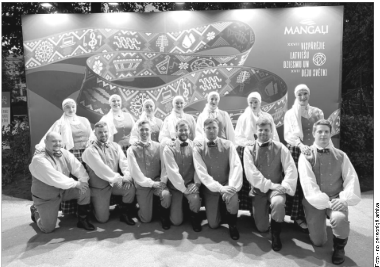
Deju kolektīvs "Pāris". "Jebkurš mirklis, kas pavadīts kopā ar kolektīvu, ir skaists. Mums kopā ir ļoti jauki un jautri gan mēģinājumos, gan braucot ceļā uz pasākumiem, koncertiem, skatēm, gan dejojot un atpūšoties," teic vadītāja.