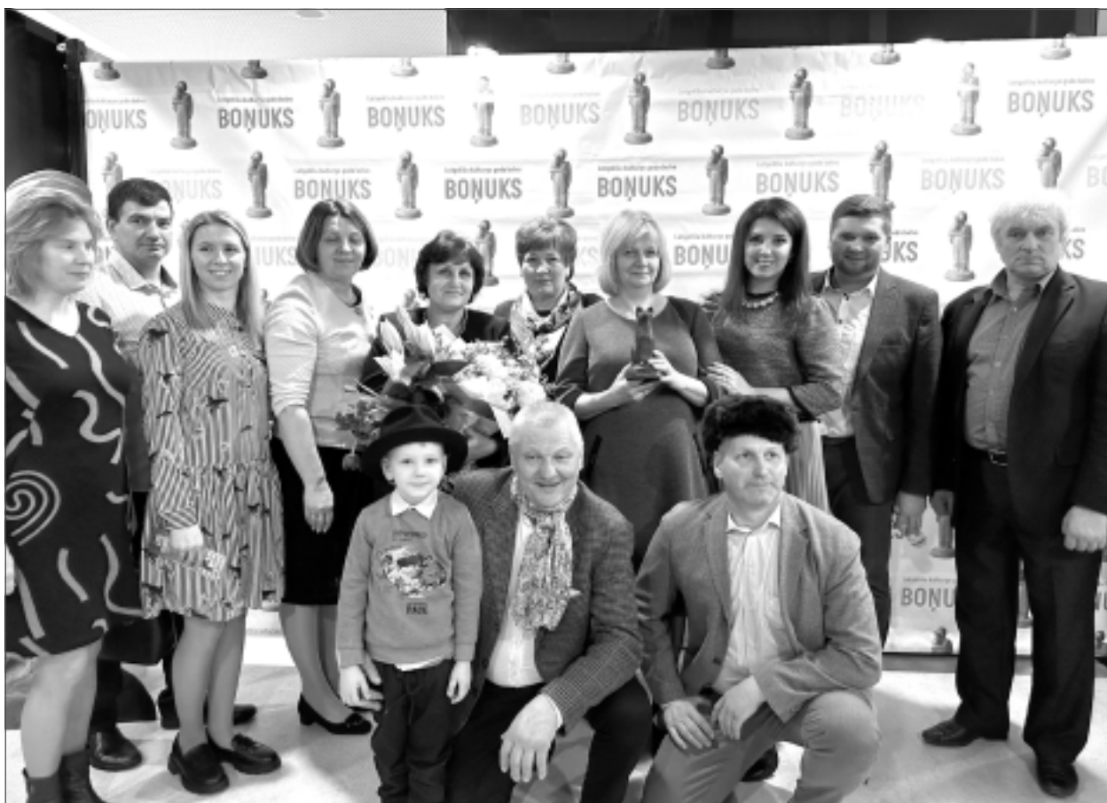
Balvu saņemot. “Palādas” ar savu darbošanos atjaunoja teātra tradīcijas Baltinavas pusē. Viņi ir tie, kuri popularizē latgalisko vidi un latgaliešu valodu, skatītājiem dāvā patīkamas emocijas un iespēju baudīt vienkāršu lauku cilvēku sirsnību, labestību ar latgaliešu humoru.

Vēl lauku amatierteātra maizes rikas garoza – dalībnieki bieži neatnāk uz mēģinājumiem, jo citam govš slima, cits vēl ceļā no Rīgas, kādam ir gripa... Lai varētu izmēģināt tie, kuri