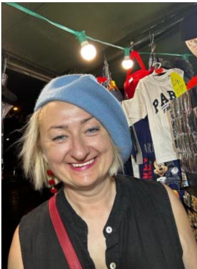
Parīzietes berete Vijai piestāv! Ielu tirgotāji šajā tūristu apmeklētākajā pilsētā ir it visur. Kad Vija pielaikojā zilo bereti, pārdevējs tūdaļ bija klāt un palīdzēja to ielocīt un uzlikt tā, kā valkā istas parīzietes.

Šogad Mullenrūža svinēs 135. dzimšanas dienu. Pirms simts gadiem Monmartras rajona bohēmiskā dzīve rosināja teju visas pasaules iztēli, un kabārē Mullenrūža ātri kļuva par obligāto galamērķi, ko skatīt Parīzē naktīs. To sauca par “pirmo sieviešu pili, elegantāko un greznāko dejas templi”. Taču arī pēc 134 gadiem Mullenrūža joprojām ir pilsētas simbols – sarkanas vējdzirnavas, kurās arvien virmo romantika, dzīvesprieks un mīlestība pret mākslu. Kabārē piedāvātajā šovu klāstā joprojām ietilpst visslavenākais priekšnesums – franču kankāns, ar cirka izrādes, operetes, balles un visa veida izklaide.