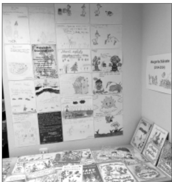
Radošie darbiņi. Bērni un jaunieši aktīvi iesaistās zīmējumu konkursā.