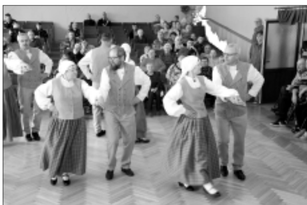
Svētku koncertā. Pansionāta iemītniekus priecēja Balvu Kultūras un atpūtas centra deju kopa “Luste”. Jāpiebilst, ka februārī pansionāts svinēs 47 gadu dzimšanas dienu.