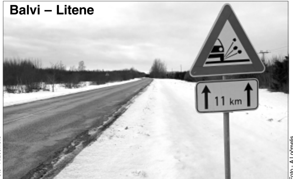
Balvi – Litene

Autoceļu nozarei – teju puse no budžeta. To, ka ceļa posmi Balvi–Stompaki un Balvi–Litene nav gluži tādi, kādiem tiem vajadzētu būt, liecina arī uzstādītās ceļa zīmes. Tikmēr Satiksmes ministrijas 2024.gada budžetā 334,5 miljoni eiro jeb 42% no kopējā finansējuma, kas ir 788 miljoni eiro, paredzēti valsts autoceļu nozarei, galveno uzsvāru liekot uz ceļu satiksmes drošības uzlabošanu. Šogad, īstenojot administratīvi teritoriālo reformu, plānoti arī tādi ceļu būvniecības darbi, lai nodrošinātu iedzīvotāju piekļuvi jaunajiem administratīvajiem centriem (izglītības, veselības un citām iestādēm). Konkrēti šim mērķim paredzēti 47 miljoni eiro no Eiropas Savienības Atveseļošanas fonda.