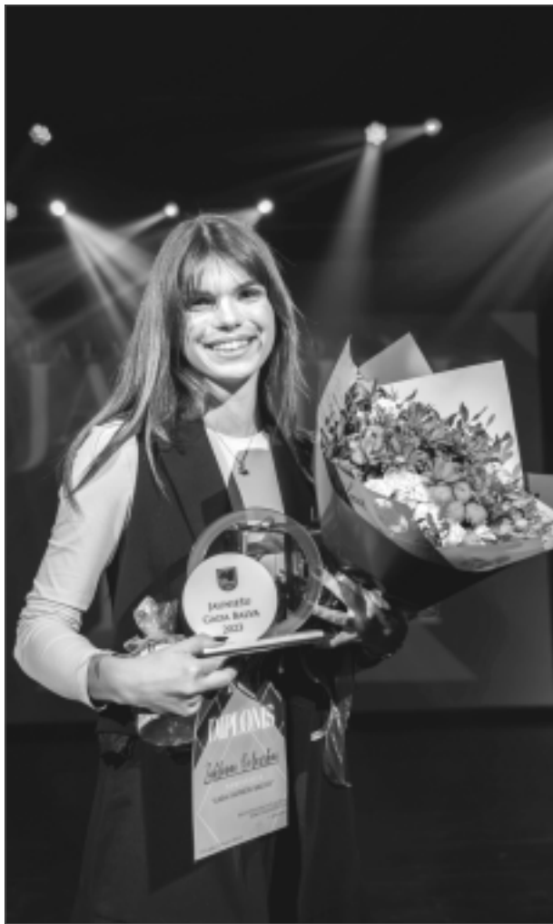
Saņemot balvu. Jaunieši novērtē Žaklīnas attieksmi un iesaisti visos Viļakas jauniešu mājas dzīves procesos.

– Veiksmīga jauniešu uz klausīšana un atbalsta sniegšana prasa apņēmību, empātiju un pacietību, kas pamatojas uz atvērtu un godīgu komunikāciju. Pieeju katram jauniešim ar uzmanību un cieņu, cenšos izprast viņu perspektīvas un jūtas. Empātijas izrādīšana un spēja redzēt situāciju ar jaunieša acīm ir būtiska, lai radītu drošu vidi, kurā viņi jūtas gatavi dalīties savā pieredzē un problēmās. Atbalsta sniegšanā balstos uz principu, ka katrs jauniešs ir unikāls, respektēju viņu indivi-