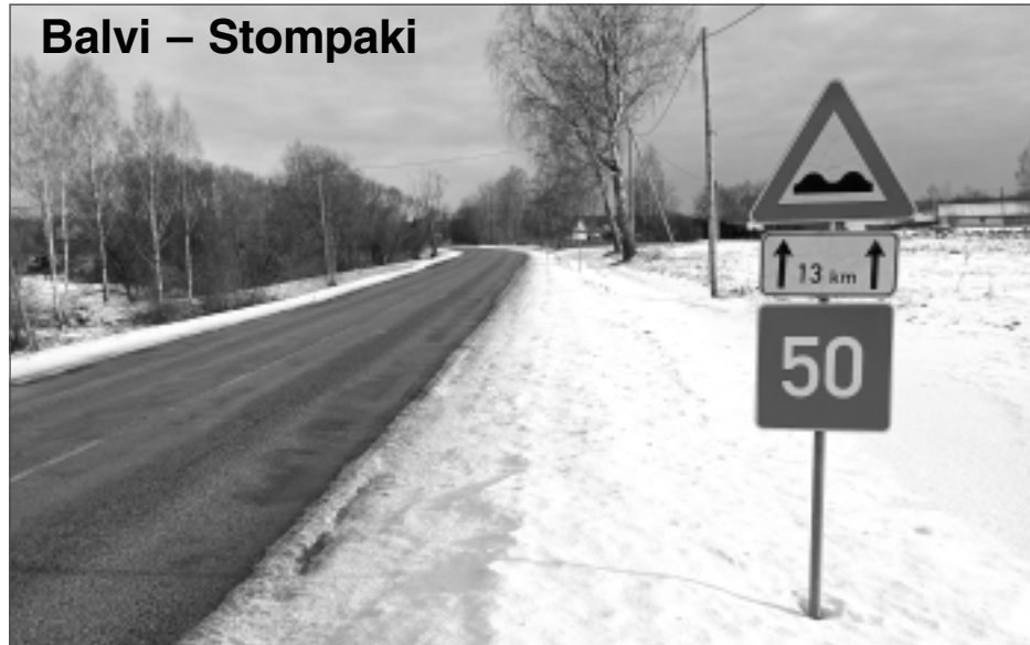
Balvi – Stompaki