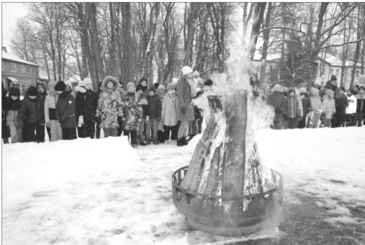
Pie atmiņu ugunsкура. Balvu pamatskolas audzēkņi ieklausījās pieaugušo vārdos, apstiprinot, ka vajadzības gadījumā aizsargās tēvzemi.

Zināmus, kā arī nezināmus faktus Balvu muižā atklāja 1991.gada Latvijas lauksaimniecības ministrs Dainis Ģeģeris: “Referātu nelasišu... Daudziem gatavība asinīs bija ieaudzina. Visi bija drosmīgi, kuri brauca uz barikādēm. Diemžēl ilgstoši ir bijuši centieni arī grozīt vēsturiskos faktus. 13.janvāra naktī, tieši tad, kad notika traģiskie notikumi Viļņā, braucu pa Vanšu tiltu un redzēju bruņutransportierus pie Nacionālā teātra. Kaut joprojām oficiālās tā laika amatpersonas saka, ka tā nebija, bet es to redzēju. Es sapratu, ka tiek izstrādāti maršruti operatīvām karadarbībām. Man šo pieredzi deva PSRS militarizēto auto-kolonnu prakse. Naktī tas nedeva mieru. Zvanījām Ivaram Godmanim, bet nevarējām viņu sazvanīt. Satiksmes ministrs Jānis Janovskis ap pulksten 12 sazvanījās. Jau iepriekš biju devis rīkojumu rajonu Lauksaimniecību departamentu direktoriem nodrošināt ar autobusiem Tautas frontes organizēto cilvēku braukšanu uz manifestāciju Rīgā. Tāpat sarunājām smagās tehnikas sūtīšanu uz Rīgu. “Dariet!” pēc pārdomām teica I.Godmanis.”