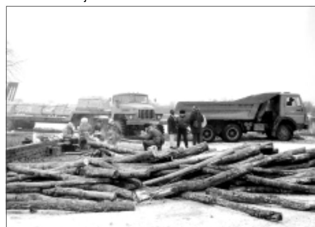
Sarūpē malku. 1991.gada janvāra barikāžu laikā.