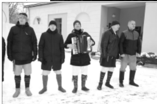
Panāk vienošanos ar bērniem. Grupas “Dzelzs Vilki” vīri jauniešus mudināja būt kārtīgiem arājiem: “Ko tas nozīmē? Tas nozīmē būt saimniekiem savā zemē. Tas nozīmē labi mācīties, kā arī palīdzēt vecākiem un vecvecākiem. Pirmkārt, jābūt kārtībai mājās. Otrkārt, paaugoties jums būs jāsakārto Latvija. Sarunāts?” “Jā,” bērni apstiprināja.