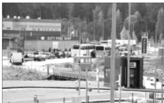
Slēdz robežu. 16.oktobrī apturēja Vientuļu un Pededzes robežšķērsošanas vietu darbību.