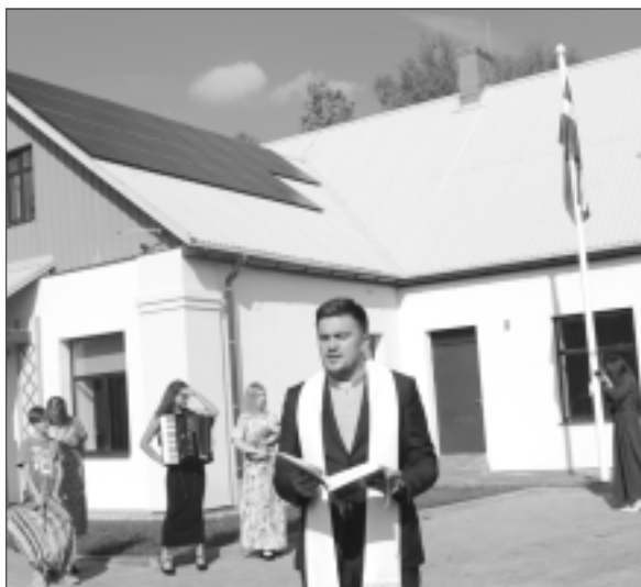
Ar Dieva svētību! 19.augustā atklāja rekonstruēto Nemateriālās kultūras mantojuma centru "Upīte".

4. un 5.augustā Viļakas 730-gades svētku kulminācija noslēdzās ar pasākumu cikla "Mana sirds Viļakai" dažnedažādām aktivitātēm, tostarp uz Viļakas ezera salas atklāja jauno vides objektu "Baltā sirds". 8.augustā Valsts vides dienests informēja, ka, veicot notekūdeņu attīrīšanas iekārtu (NAI) testēšanu, 2023.gadā 26 NAI Latvijā ilgstoši piesārņo vidi, tostarp "Balvu pansionāts". 11. un 12.augustā nosvinēti Kubulu pagasta svētki. 12.augustā Balvos sumināja vairāk nekā 80 bērnu un jauniešu Zekīšu, Bērniņas un Pilngadības svētkos. 13.augustā Balvu estrādē, zaļumballē, vietējiem uzbruka agresīvi noskaņoti viešinieki. 18.augustā Balvu ezers jau astoto reizi pārtapa par brīvdabas estrādi, kur notika koncerts "Mūzika saulrietam". 23.augustā Balvu Kultūras un atpūtas laukumā ikviens varēja kļūt par Baltijas ceļa simboliskās ķēdes dalībnieku. 24.augustā SIA "Balvu un Gulbenes slimnīcu apvienība" trešo reizi organizēja Pateicības dienu. 26.augustā Balvu pludmales volejbola laukumos vairāk nekā pussimts sportisti cīnījās nakts volejbola turnīrā "Balvi Open 2023", bet Krišjānos otro gadu pēc kārtas notika muzikantu saiets "Re, kur muzikanti spēlē". 26. un 27.augustā aizvadījām "Mājas kafejnīcu dienas 2023" Balvu novadā.