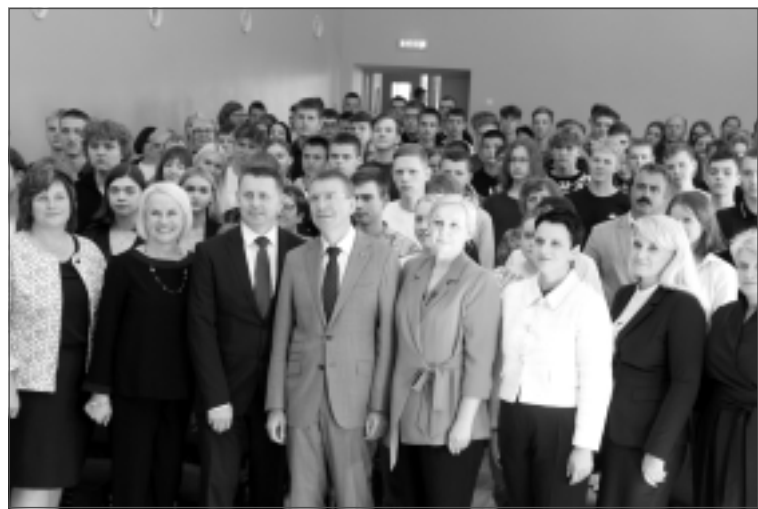
Balvu Valsts ģimnāzijā. 12.septembrī Valsts prezidents Edgars Rinkēvičs darba vizītē apmeklēja Balvu novadu.

1.septembrī, Zinību dienā, Balvu sākumskolā 'labrīt' teica 465 audzēkņi, bet Viļakas Valsts ģimnāzija zaudēja valsts ģimnāzijas statusu. 9.septembrī Žiguros aizvadīja Meža dienu. 2.septembrī Viļakas estrādē nosvinēja Tēva dienu. 14.septembrī Baltinavas kultūras namā atklāja "Grāmatas svētkus Baltinavā". 16.septembrī Nemateriālajā kultūras mantojuma centrā "Upīte" mūziķi, dzejnieki un skatītāji tikās latgaliešu mīlas dzejas un dziesmu festivālā "Upītes Uobeļduorzs". 23.septembrī Balvu Kultūras un atpūtas centrā apbalvošanas pasākumā "Mūsu lepnums" pasniedza Gada balvas kultūrā deviņās nominācijās, bet 29.septembrī godināja 23 pedagogus pasākumā "Gada skolotājs 2023". 24.septembrī balvenietis Gunārs Plavnieks Balvu ezerā noķēra 22 kilogramus smaigu samu. Septembrī mūspuses pastnieki saņēma jaunas automašīnas. 28.septembrī Balvu novada domes sēdē deputāti atbalstīja ieceri noslēgt Sadarbības līgumu ar Ukrainas Republikas Odesas apgabala Baltas pilsētas pašvaldību.