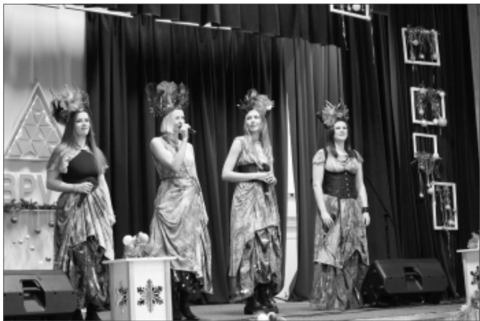
Jaudīgs priekšnesums. "Tautumeitu" uzstāšanās pārsteidz un iedvesmo.

Sagaidot svētkus, savējos iepriecināja Balvu Profesionālā un vispārizglītojošā vidusskola, aicinot pacilājošu gaisotni baudīt ne vien skolas audzēkņus, bet arī viņu vecākus, darbiniekus un pensionētos skolotājus.