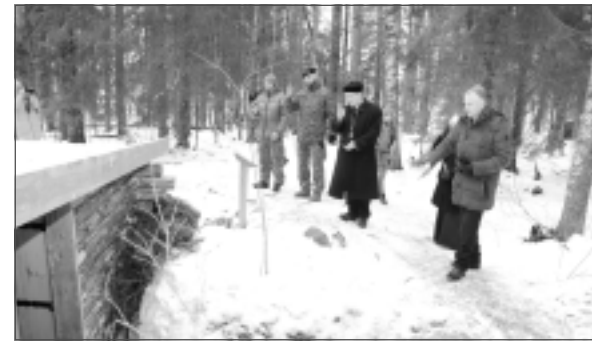
Iesvēta jaunos bunkurus. Nacionālo partizānu bruņotās pretošanās atceres dienas pasākumu laikā Balvos notika arī zinātniskie lasījumi.