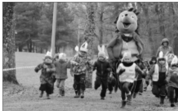
Kurš ātrāks? Zaļajā ceturtdienā Viļakas pirmsskolas vecuma bērni sakopēja visus spēkus, lai Zaķu skrējiena laikā pirmie nonāktu finišā.