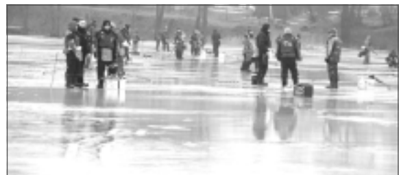
Ezers kā slidotava. Latvijas čempionāta zemledus maksšķerēšanas pirmajā posmā sportisti noķēra 147 kilogramus zivju.