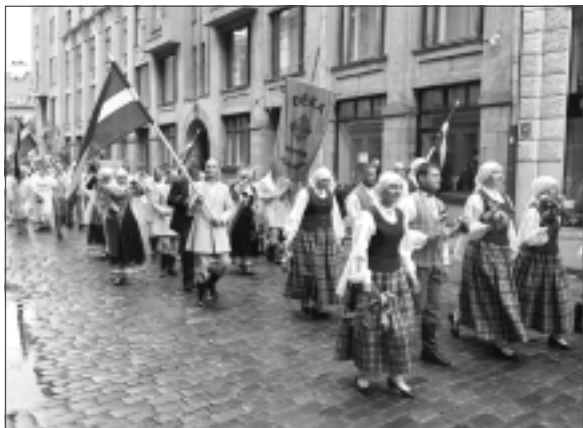
Dižojamies ar balto Abrenes tērpu. Uz XXVII Vispārējiem latviešu Dziesmu un XVII Deju svētkiem devās 40 mūspuses kolektīvi (780 dalībnieki, no kuriem 672 – unikālie).

1.jūlijā Naudaskalna Tautas namā aizvadīts starpnovadu vokālo ansambļu sadziedāšanās pasākums "Dziesma vasarai – 2023". 11.jūlijā Viļakā atklāja 7.starptautisko glezniecības plenēru "Valdis Bušs 2023". No 12. līdz 16.jūlijam aizvadījām Balvu novada svētkus (otrajos pašvaldības darbinieku sporta spēlēs uzvaras laurus plūca Balvu pārvalde). 14.jūlijā Baltinavā notika netradicionālās zemnieku saimniecību un saimniecību apvienību sporta spēles. 19.jūlijā, sākot svinēt Viļakas pilsētas 730 gadu jubileju, pie Viļakas evaņģēliski luteriskās baznīcas atklāja jaunu vides objektu – grāmatu. 22.jūlijā Bērzpils pagasta "Tabakovā" pulcējās sportisti no visas Latvijas, lai startētu pirmajās "Jaunbērziņu treniņšacensībās konkūrā". 23.jūlijā Balvu pagastā vilki nokoda 34 jērus. 27.jūlijā Balvu novada domes sēdē deputāti akceptēja lēmumprojektu par Viļakas skvērā esošā padomju režīmu slavinošā pieminekļa demontāžu. 29.jūlijā Tilžā aizvadīja pagasta svētkus, sieviešu deju kopu festivālu "Spīganu dejas 2023", kā arī Tilžā divas dienas sacentās 30 šahisti Balvu novada atklātajā šaha turnīrā.