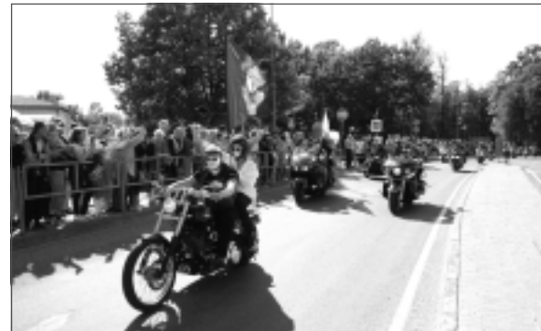
Dāvana Balviem. 10.jūnijā pēc trīs gadu pārtraukuma Balvus atkal rūcināja “Motociklu vasara”.