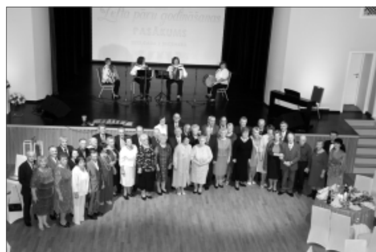
Zelta pāri. 2.decembrī Balvu Kultūras un atpūtas centrā godināja divdesmit Zelta pārus, kuriem kopā ir 54 bērni, 100 mazbērni un 9 mazmazbērni.