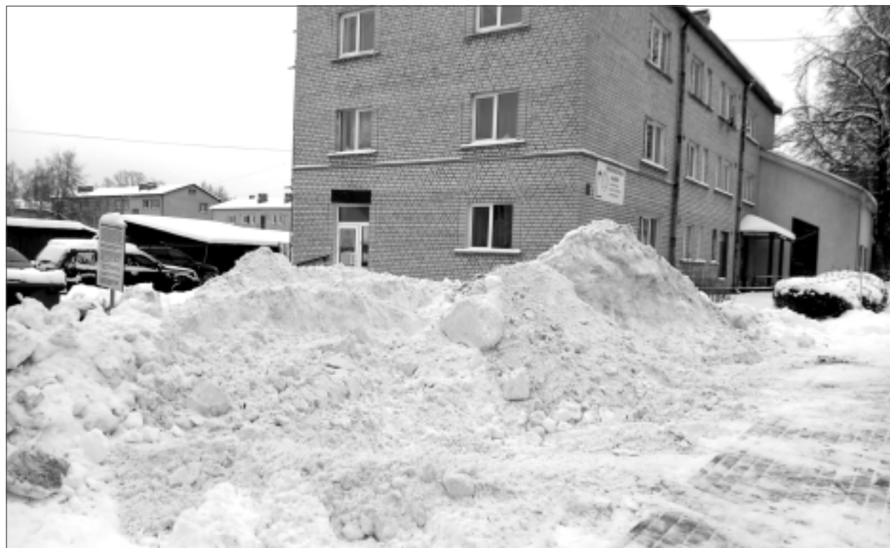
Ziema dara savu. Tīrot ielas un ietves, Balvos parādās arvien lielāki sniega krāvumi (foto – Teātra iela 1). Iespējams, sastumto sniegu arī izvedīs, bet pagaidām jācenšas sadzīvot, kā ir. Laika apstākļi var krasi mainīties. Šonedēļ sola puteņus un atkusni, ietves var kļūt pamatīgi apledojušas. Tādā laikā, ja vien iespējams, labāk palikt mājās un lieku reizi ārā nedoties.