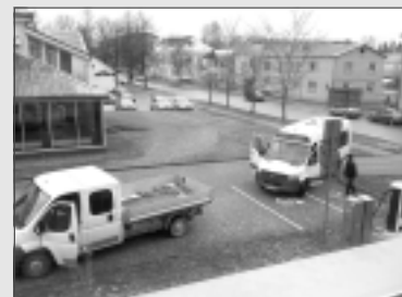
levelk Balvos. Baterija izlādējās nepilnus 5 km pirms Balviem.

16.novembrī Balvu novada domes Finanšu komitejā pirmajā jautājumā bija plānots iepazīties ar informatīvo ziņojumu par elektroautobusiem un iespējamiem risinājumiem to uzlādei. Tāpat izskanēja informācija, ka deputātiem būs iespēja doties izbraucienā, lai pārliecinātos par transportlīdzekļa priekšrocībām. Diemžēl pirmā jautājuma izskatīšanu atcēla, jo firma, kas bija ceļā uz Balviem, kavējās. Vēl pēc krietna laika deputāti saņēma ziņu, ka elektroautobusam izlādējusies baterija pie autobusu pieturas “Kurna”. Firmas pārstāvis paskaidroja, ka Latvijā ir problēmas ar uzlādes stacijām.