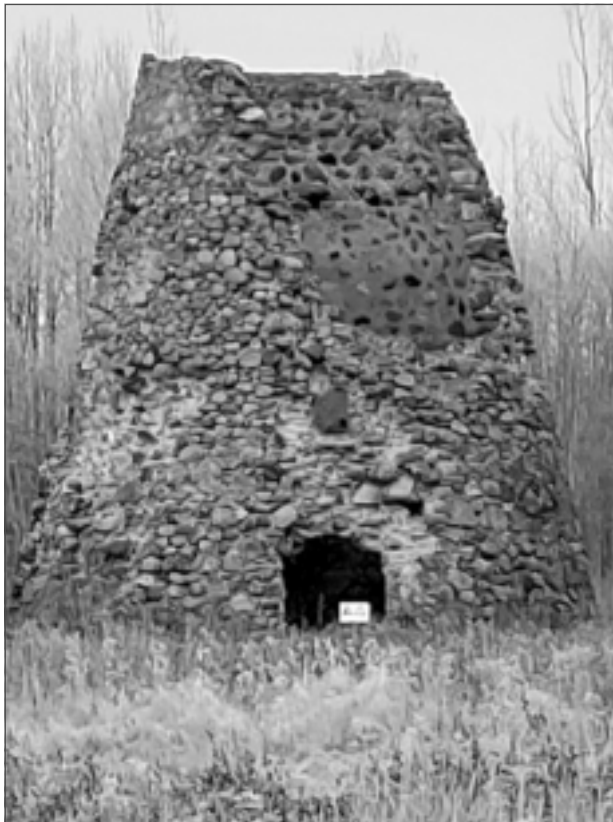
Mežarijas vējdzirnavas. Savulaik tām bijuši četri stāvi, vējdzirnavas darbojušās līdz 1923.gadam, pašlaik saglabāties tikai korpusi.

– Katru gadu, sastādot budžetu nākamajam gadam, plānojam naudas līdzekļus dažādiem remontdarbiem un saimnieciskiem darbiem, ir jābūt gataviem arī neparedzētiem izdevumiem. Pagasta pārziņā ir Viksnas bibliotēka, tautas nama un feldšeru veselības punkta saimniecisko darbu veikšana, Viksnas pirmsskolas izglītības un Viksnas skolas ēku, ciemata ūdensvada un attīrīšanas iekārtu uzraudzība un uzturēšana, pagasta teritorijas labiekārtošana un sakopšana. Viksnas pagasta budžeta ieņēmumu daļā pārsvarā ir ieņēmumi no komunālajiem pakalpojumiem un zemes nomas maksas, bet izdevumu daļā redzam ne tikai izdevumus par saimnieciskiem darbiem un remontdarbiem, bet arī izdevumus par ārpalpojumiem,