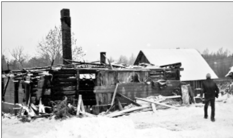
Krāsmatas. Mājas deva pajumti ģimenei, un katram tur bija savs stūritis. Tagad sniegs krīt tikai uz melniem, apdegušiem balķiem...

Atbalstu cietušajai ģimenei sniedz arī pagasts. Vecumu pagasta pārvaldnieks