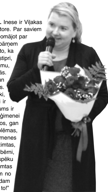
Brīvbrīdi sagatavoja I.Zinkovska

Inese ir Viļakas kultūras nama direktore. Par saviem vecākiem viņa teic: “Domājot par saviem vecākiem, mani pārņem lepnums. Es priecājos par to, ka viņi mums ir tādi – braši, stipri, izpalīdzīgi, ar savu redzējumu, padomu un vienmēr līdzās. Kopš sevi atceros, mamma un tētis ir mūsu stiprais balsts. Gandrīz visi latviskie svētki, jubilejas un citi svarīgi mirkļi ir pavadīti kopā. Vecāki mums ir iemācījuši pašu galveno, – ģimenei jāturas kopā gan priekos, gan bēdās un jārisina problēmas, palīdzot pārējiem ģimenes locekļiem. Esam no tādas dzimtas, kuras galvenā vērtība ir bērni, viņos mēs ieguldām laiku, spēku un mīlestību. Tā ir mūsu dzimtas bagātība, ko saņēmām no saviem vecākiem un nododam tālāk. Paldies viņiem par to!”