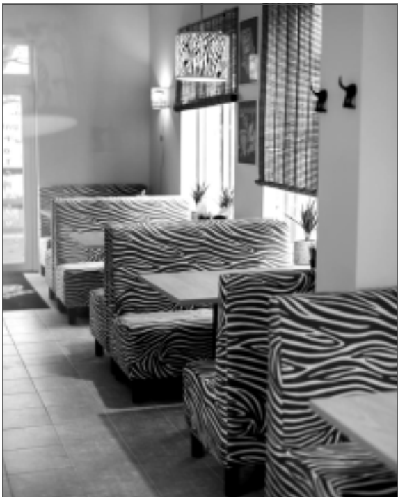
Interjers zebbras motīvos. Jaunatvērtā picērija "Zebra" Smiltēnē klientus sagaida ar skaistu un gaumīgi veidotu interjeru, ko pircēji jau paspējuši novērtēt ar pozitīvām atsauksmēm.

– Ļoti ceru, ka būšu kaut kur tepat, bet nevaru apsolīt, jo mana sirds velk kaut kur citur. Uz Spāniju braucām ar domu nākotnē tur iegādāties īpašumu. Un, kas zina, varbūt arī tur kādreiz atvērsies picērija "Zebra"? Atzišos, ka Spānijas sabiedrība mani pozitīvi uzrunā. Mani vienmēr fascinē, ka, ejot garām svešiem cilvēkiem, viņi vienmēr pasveicina, visur atver durvis, smaida viens otram. No Spānijas vienmēr atbraucu tik pacīlātā garstāvoklī, un it kā no nekā – tikai no vides, kādā atrados. Tieši tādēļ neesmu gatava to savu vienu dzīvi, kas man iedota, ņemt un izniekot. Es ļoti milu Balvus, bet reizēm man ļoti skumji par cilvēkiem, kuri atļaujas atnākt uz picēriju un pazemot manas meitenes. Un tādu gadījumu ir daudz. Bet vairāk, protams, ir to jauko un atsaucīgo klientu. Picērijas atklāšanā Smiltēnē man visi vēlēja veiksmi un izturību. Un tas sildīja sirdi. Reizēm jau neko daudz nevajag – vienkārši pateikt paldies, ka esam.