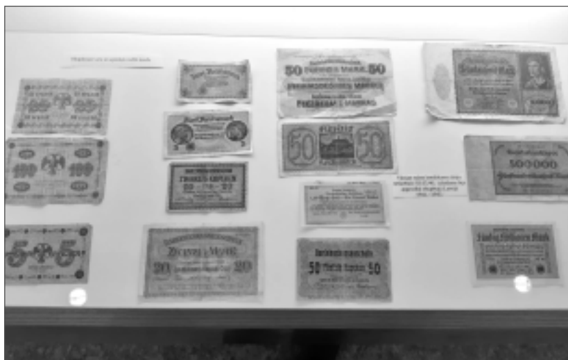
Senās naudaszīmes. Viļakas muzejā skatāmas naudaszīmes no cara laikiem līdz mūsdienām.

Atmodas posmā tika izdota Jāņa Raiņa 1990. gada jubilejas monēta. Izstādē var redzēt arī vācu naudu, kurai uz banknotes rakstīts 200 miljardi markas, kā ar apskatīt I un II pasaules kara naudu, piemēram, reihsmarkas. Pirmās