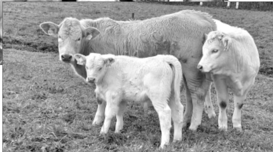
Gaļas šķirnes liellopi. Ganāmpulkā ir gan Šarolē šķirnes, gan krustojuma teliņi, govīs un bullis.