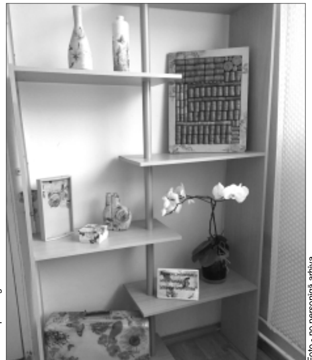
Dekupāžas darbi. Dekupāža salvešu tehnikā ir lieliska iespēja atsvaidzināt un uzlabot senu, nokalpojušu lietu, jo priekšmeti iegūst jaunu un pievilcīgu izskatu.